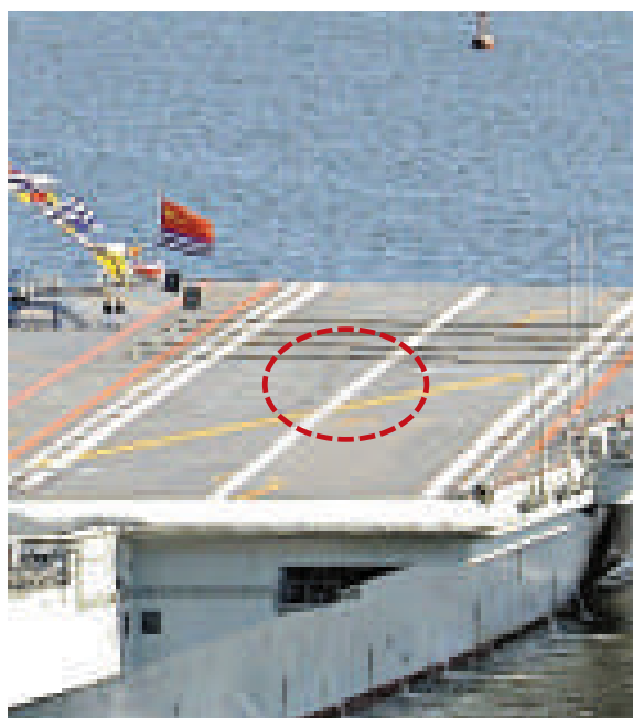
▲「遼寧」艦甲板靠近攔阻索的前方有明顯的輪胎印跡（紅圈）

【本報訊】中國航母「遼寧」艦30日停靠在遼寧省大連港碼頭，完成其交接入役後的首次航海任務。根據網友拍攝到的照片，「遼寧」艦甲板靠近攔阻索的前方有輪胎印跡，猜測已經進行了相關艦載機着艦測試。