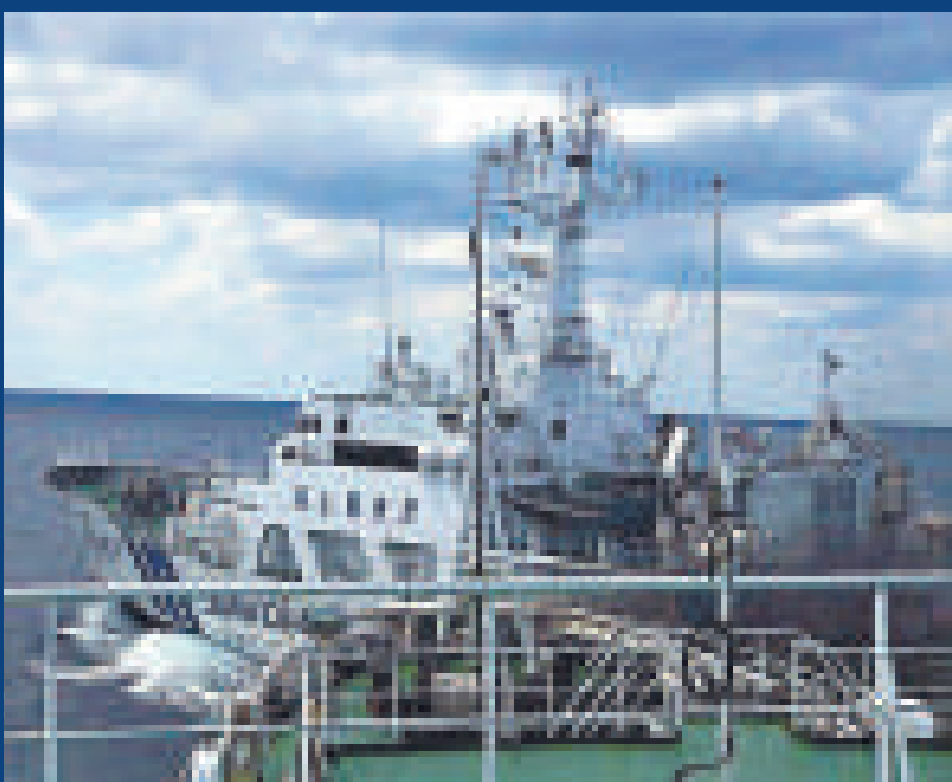
▲中國海監50與日本「甘木」號近距離對峙時

羅照輝着重闡述了中方在釣魚島問題上的原則立場，俄方應詢介紹了俄日關係情況。雙方認為，維護二戰勝利成果和戰後國際秩序，對保持國際及地區和平穩定具有重要意義。