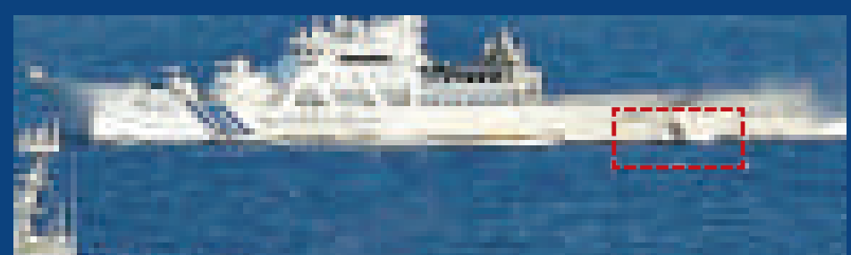
▲「甘木」號船尾部分受損（紅框）