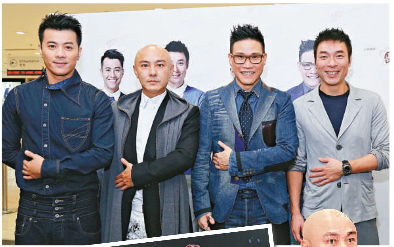
▲Big 4 任健康大使，呼籲大家關注乙型肝炎。