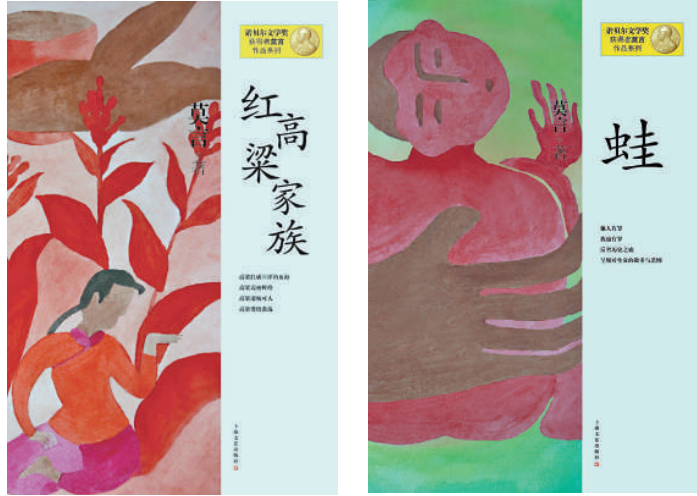
▲「莫言作品系列」中的《紅高粱家族》（左）和《蛙》

【本報訊】記者楊楠上海報導：首位獲諾貝爾文學獎的中國籍作家莫言最新作品系列，日前由上海文藝出版社、上海書城聯袂首發。從二〇〇五年的《與大師約會》，到二〇〇八年的《檀香刑》、《生死疲勞》，從二〇〇九年的《蛙》到今年的「莫言作品系列」，上海文藝出版社與莫言一直保持合作關係，擁有莫言十六部作品的出版權利。