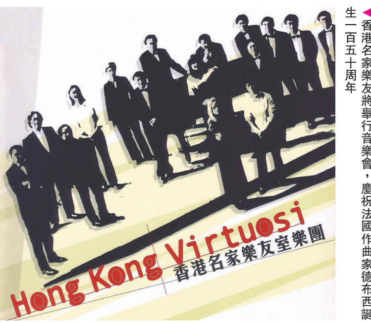
Hong Kong Virtuosi 香港名家樂友室樂團