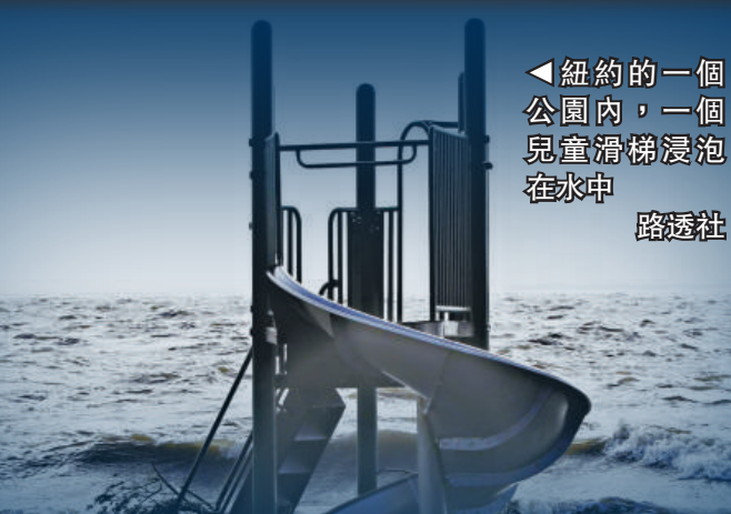
◀紐約的一個公園內，一個兒童滑梯浸泡在水中