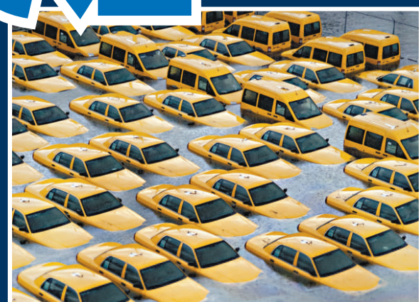
▲紐約著名的黃色的士浸泡在霍博肯區的一間停車場內