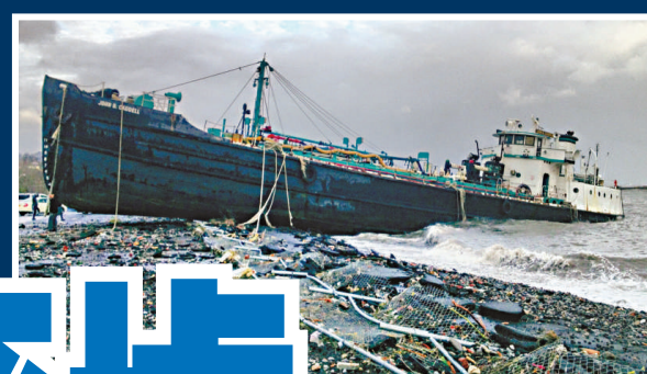
▲10月30日在斯 塔滕島，一艘168 呎的高的運水船擱 淺在岸邊