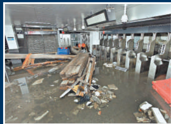
▲大水將雜物沖進紐約的一個地鐵站