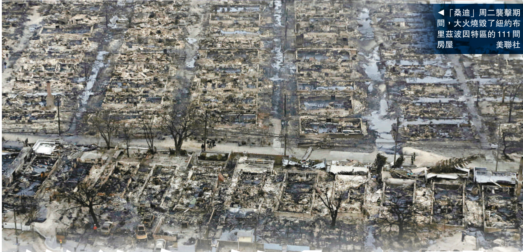
◀「桑迪」周二襲擊期間，大火燒毀了紐約布 里茲波因特區的111間 房屋