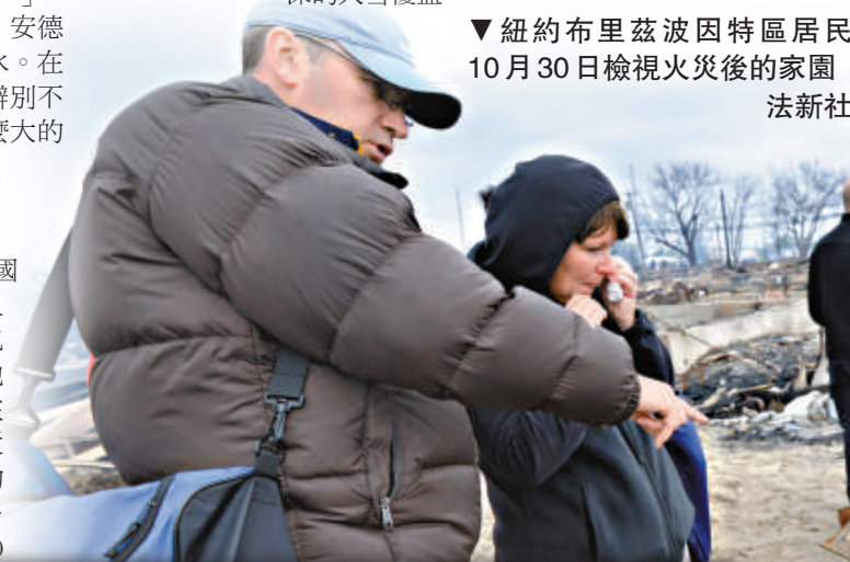
▼紐約布萊茲波因特區居民 10月30日檢視火災後的家園

空公司共取消了超過18,110次航班。紐約肯尼迪國際機場和紐瓦克機場將於周三晚間7點重啓。香港國泰航空計劃於11月1日起，陸續恢復紐約航班服務。不過，10月31日由香港出發的CX830、CX840以及由紐約出發的CX845、CX841及CX831等五班航機仍取消。美國多個州的手機服務停頓，一些緊急求救電話受影響。有些城市，例如華盛頓、費城和波士頓，基本上不受風暴影響，但是風暴深入美國內陸，直達俄亥俄州，而西弗吉尼亞州某些地區則被一米深的大雪覆蓋。