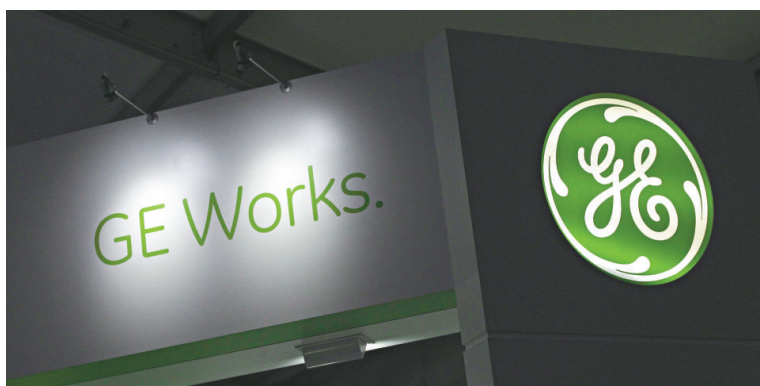
▲美國通用電氣本月發行70億美元債券

根據彭博資料，今年以來，企債銷售較一年前同期升18%，相對2010年升19%。其中以美國企債發行量升幅最為顯著，由2011年首10個月至今，銷售上升25%，無論是美國投資級別或垃圾級別的企債，今年發行量都有增加，投資級別企債發行升22%至9188億美元，垃圾級別企債也有35%升幅至2925億美元。