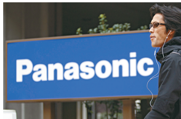
▲日本松下預計本財年虧損7650億日圓，接近上年度虧損額

即便如此，Curras表示，中央政府今年的赤字將低於官員預測，主要由於年末緊縮措施開始生效將推升政府收入。她稱，預計今年中央政府赤字佔GDP比例將低於4%，可以抵銷社會保障體系的資金短缺。