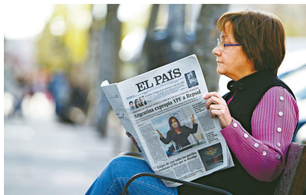
▲標普將阿根廷信用評級下調一級，惠譽同時降低阿根廷信貸展望至負面

巴克萊周三發聲明稱，正在配合美國相關部門就此進行調查。近期捲入連串醜聞後，巴克萊正努力重建其聲譽，不過消息指稱，巴克萊可能再度因為此事被美國當局罰款。