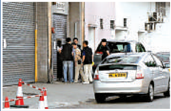
◀警方昨日繼續封閉現場調查