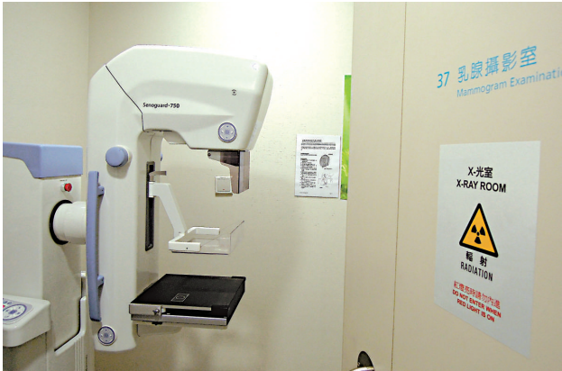
▲賽馬會天水圍社區健康中心設有乳線攝影室

而入境處及警務處在上月三十一日在同一行動中，共搜查上水十七個水貨黑點，包括晉科中心及劍橋廣場鄰近的新運路、彩園路一帶，拘捕一男兩女涉嫌從事水貨活動而違反逗留條件的內地旅客，年齡介乎四十八至四十九歲。行動中檢獲一批懷疑作水貨用途的奶粉。