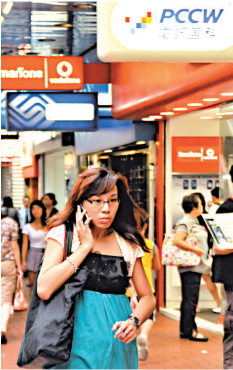
▲通訊辦預計，調解服務計劃首年最多可處理五百宗個案

不受理的個案則包括速度緩慢或覆蓋欠佳等服務質素問題、瑣屑無聊或無理纏擾個案、涉及收債方法、電訊商要求索取資料，或個案涉及不遵從《電訊條例》的實務守則