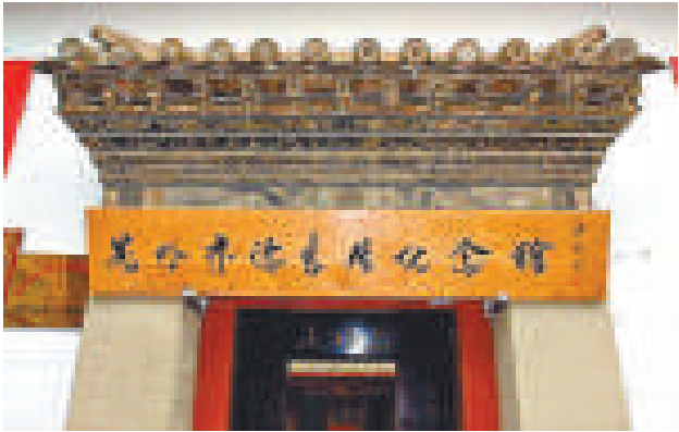
▲在這裡朱德放棄了高官厚祿，從一個舊民主主義革命者，轉變成為新民主主義革命者 網絡圖片

【本報訊】據中新社昆明二日報道：在昆明五華山下的紅花巷4號和小梅園巷3號，坐落着兩個清雅的院子，這兩座富於中國傳統風格的院落，正是朱德在昆明的舊居。近日，記者走入這兩座古老的建築，追憶朱德在昆明的故事。