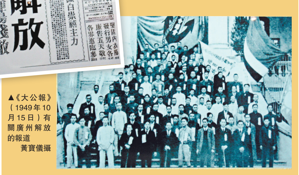
▲《大公報》（1949年10月15日）有關廣州解放的報道