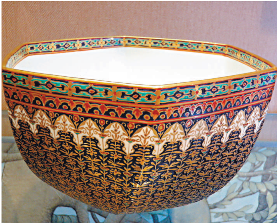
▲泰國公主朱拉蓬設計監製的五彩搪瓷碗

從國共合作到土地革命，從抗日戰爭到解放戰爭，從新中國成立到改革開放，廣東黨組織始終順應潮流，代表南粵幾千萬兒女發出時代強音，一衣帶水的香港，也一直與廣東與祖國保持着密切聯繫，共同前進。