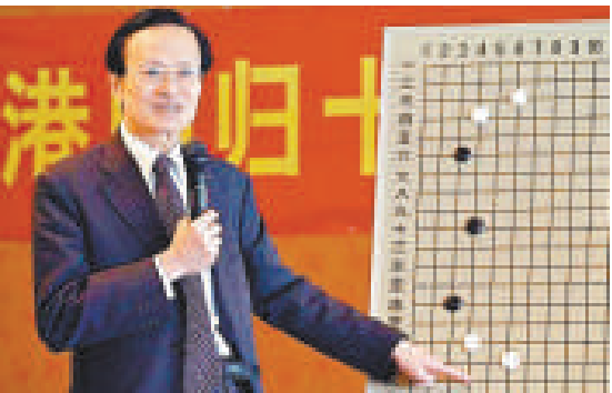
▲2007年，陳祖德在慶祝香港回歸十周年的「深業杯」圍棋賽上講解棋局 網絡圖片

據中國棋院院長劉思明介紹，11月5日上午，中國棋院會為陳老舉行一個集體弔唁儀式。「儘管老人不希望影響太多人，但我們和他家人商量後，還會於7日在八寶山舉行簡單的遺體告別，送老人最後一程。」