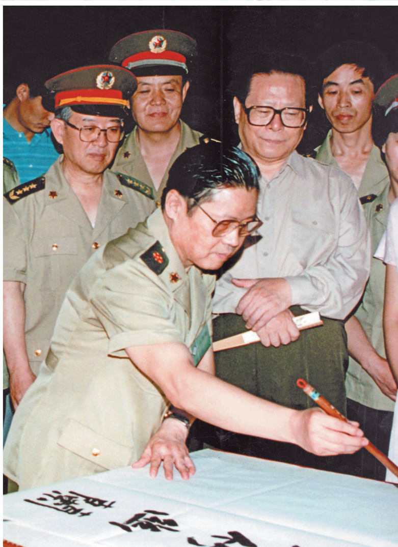
▲1995年7月2日，中共中央總書記、國家主席、中央軍委主席江澤民（右二）在中國人民革命軍事博物館有興趣地觀看李鐸現場創作，並予以稱讚

李鐸，字仕龍，從戎60年，從士兵到將軍；弄墨70載，從愛好到大師。他以自己總結的「興趣、勤奮、悟性、路徑」8個字，演繹和寫就了一位將軍、一位書法大家的精彩人生。