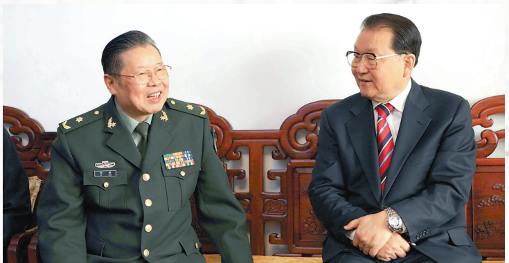
▲2011年1月25日，中共中央政治局常委李長春專程來到李鐸家中，代表胡錦濤總書記和黨中央向他表示親切慰問

那時，一個初中仔子想上軍校，那是癩蛤蟆想吃天鵝肉啊。但他想，既然下決心要考，首先得有個好名字。於是找出字典翻看，當他看到「鐸」字就立即停住了。鐸，字義很好：發聲的古代樂器，多用於軍旅，還有喚醒民衆之義；鐸，是個形聲字，讀音擲地有聲，寫起來也好看。好，就用這個名字去報軍校！