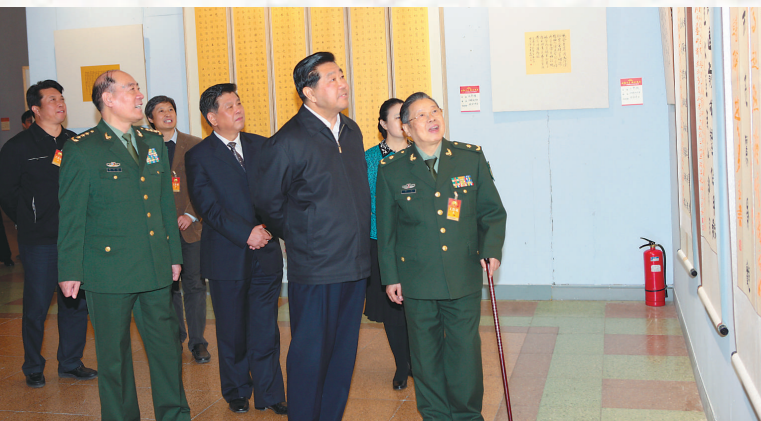
▲2010年4月25日，李鐸將軍等陪同中共中央政治局常委、全國政協主席賈慶林（右二）參觀正在中國人民革命軍事博物館舉行的「李鐸師生書畫展」

私塾4年，他還學了諸如《大學》、《中庸》、《論語》、《孟子》等「四書」的課程。那時的學習是「讀一背誦一再讀一再背誦」，雖然當時也不理解書中的內容，卻爲後來的再次學習、提高素養打下了基礎。其中，《學而》、《先進》等章節至今還記得。