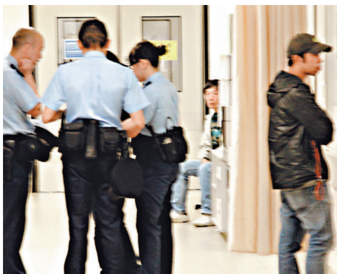
燒炭情侶的友人在醫院協助警員調查

【本報訊】油塘油麗邨昨晚揭發男傷女死燒炭案。一對情侶疑感情問題及失業困境，在住所內齊齊燒炭尋死，友人登門尋訪，拍門無回應報警，由消防員破門入屋，赫見兩人已昏迷單位內，立即送院救治，惜女子最終返魂無術，其男友則搶回性命。