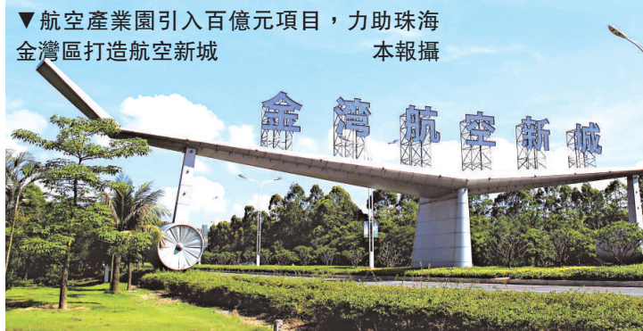
▲航空產業園引入百億元項目，力助珠海金灣區打造航空新城

珠海航空園是日前廣東省唯一的民用航空製造業基地，經過 4 年開發建設，至今已引進航空要素項目 21 個，投資總額突破 108 億元，僅今年新引進重點項目 7 個，實際利用內資 18 億元，累計完成基礎設施投資 2.95 億元。該園規劃總面積 99 平方公里，目前可用建設用地 4.3 平方公里，規劃填海約 12.5 平方公里。該管委會負責人表示，目前該園正加快引進航空產業及配套設施項目，打造全產業鏈，爭取建成全國最大通用航空產業綜合性基地。