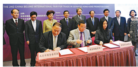
▲北京市商務委員會、商務部服務貿易及香港貿易發展局在香港會展共同簽署第二屆京交會合作備忘錄

香港特區政府財政司司長俊華致辭時表示，京港兩地在服務貿易領域有很大合作空間。目前，有不少香港人在北京從事服務業，包括金融服務、會計、法律、物流運輸、餐飲等領域，都有很大的發展空間。他們所累積的知識和經驗，對內地的合作夥伴也有參考價值。