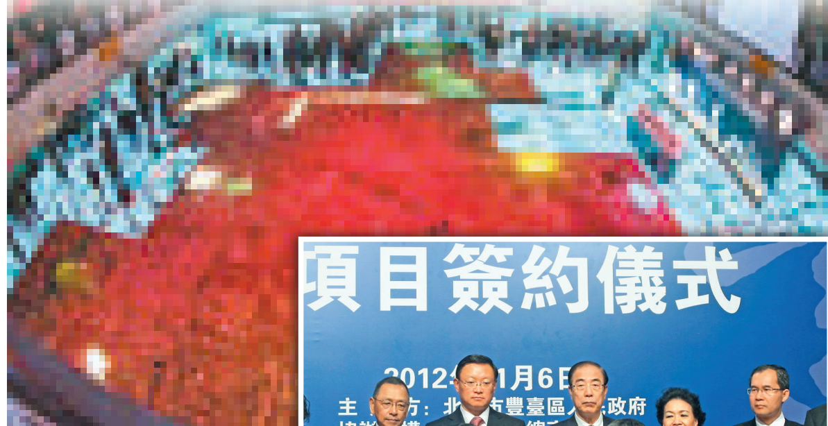
▲北京規劃展覽館的巨大沙盤展示了北京打造世界城市的決心

北京主管投資促進工作的官員則認為，區縣這種競爭是一種良性競爭，有利於北京的經濟發展。以文創產業為例，目前北京各區縣都在打造自己的文創基地，北京市只會根據大的區域和產業規劃，從中協調，使得各個區縣文創產業的發展各有側重，而不是一哄而上。