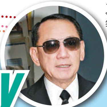
楊受成 令成龍 哭不得