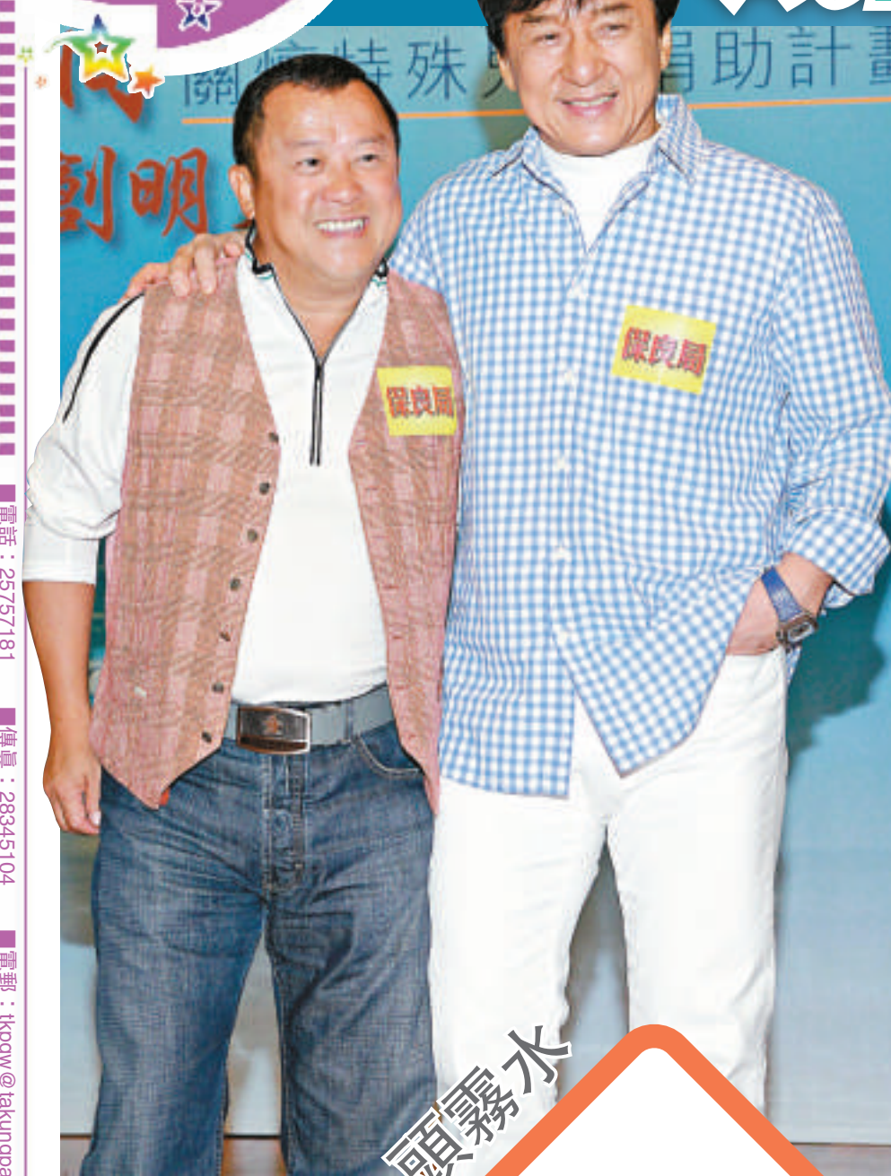
▲志偉(左)、成龍拍住行善

保良局「點滴創明天」昨日於銅鑼灣保良局舉行，「點滴關懷愛心大使」成龍、籌備委員會主席曾志偉、導演黎妙雪、保良局主席梁寶珠、保良局總理何超鳳等出席，眾人於現場呼籲大家捐款，為「特殊幼兒發展基金」籌款。