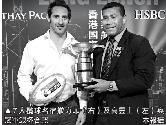
▲7人欖球名宿撒力菲(右)及高靈士(左)與冠軍銀杯合照

熱心推廣欖球的撒力菲，將與高靈士於明年的7欖賽前夕聯袂來港，舉辦爲期兩日的青少年欖球訓練營，教授本地年輕一代欖球技術。現時執教斯里蘭卡國家隊的高靈士表示，亞洲欖球發展一日千里，他相信中國隊及港隊未來都會有極大的進步。