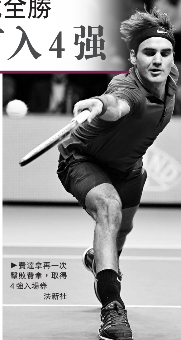
►費達拿再一次擊敗費拿，取得4強入場券