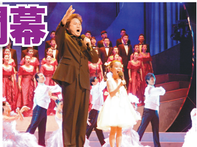
▲著名男高音歌唱家戴玉強和八歲女孩高小鈞一起領唱開場曲《我的祖國》

本次合唱錦標賽於今日至本月十四日在廣州舉辦，共有來自四十三個國家和地區一百六十四支合唱團，超過七千人參賽。其中，境外團體七十三支，參賽人員三千人左右；境內團體九十一支，參賽人員四千人左右。本次合唱錦標賽共安排了二十五場比賽，設星海杯大獎賽和廣州國際合唱公開賽兩大類比賽。