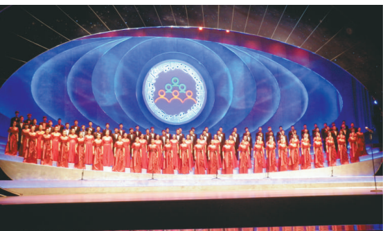
▲開幕晚會在《迎賓曲》中拉开序幕

中國北京魔術大會將每兩年舉辦一屆，並核心打造金長城魔術大賽品牌，同時北京昌平還計劃舉辦與之交替每兩年一屆的亞洲大學生魔術大會。創辦「魔術駐場演出」，作為長期經營項目；成立北京金長城魔術文化有限公司，開拓全國魔術藝術市場，在各地巡迴演出，推動魔術藝術市場化、產業化。