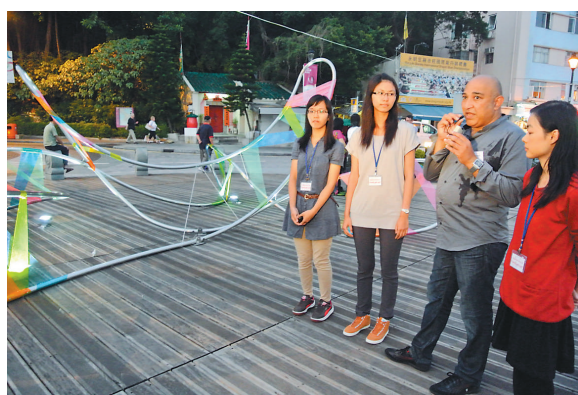
▲學生及指導老師一同介紹作品「繪光」

「藝綻公園2012」赤柱第三階段展覽展至明年一月二十六日，詳情可瀏覽網站 www.artliveatpark2012.hk 或致電二七八〇二二三。