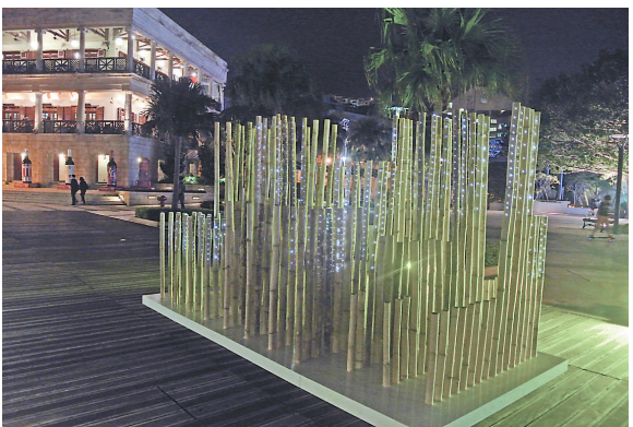
▲夜幕中的「濛」

時間呈現了不同的光彩。以高低不一的竹竿造成的作品「濛」，在夜色中如林立的高樓；以鋼及PVC軟膠造成的「繪光」，將光線幻化成繽紛色彩；「浮光·掠影」則用有機玻璃製成，創作者的靈感來源於海平面淡淡的漣漪；「鱗·光」使用了鏡面膠片，讓觀者置身於粼粼閃爍的海面上。四組作品與赤柱海濱的周邊環境互相呼應，以光影演繹了城市與自然之間的聯繫。