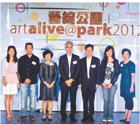
▲參加第三階段赤柱展覽的嘉賓合影

此次階段展覽名為「捕捉城市光影 聚焦自然雋美」，由香港城市大學建築科技學部的學生圍繞「光」作主題而創作。到赤柱廣場時，太陽剛下山，天色漸迷濛，設計者及指導老師介紹到第三件作品「濛」的時候，夜幕已經完全籠罩了廣場，作品正好在白天與黑夜兩段