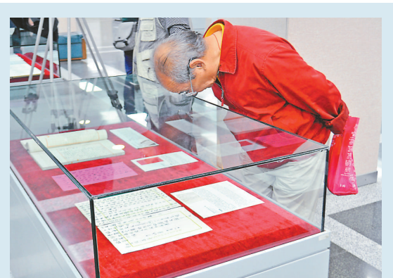
▲觀眾在仔細欣賞梁啟超真跡

【本報訊】記者張帆上海報道：一批由梁啟超胞弟梁啟勳後人整理珍藏的梁啟超檔案近日在塵封百年後現世。受梁啟勳後人委託，這批名為「南長街54號」藏梁氏檔案將於十二月初在「北京匡時2012年秋季藝術品拍賣會」上公開拍賣。在此之前，從上月末開始，檔案先後在北京、上海、南京、廈門、廣州展開為期一個月的巡展。