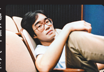
▶楊永德一九八三年參演《兩女性》的劇照