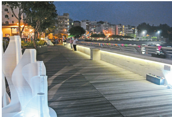
▲「浮光·掠影」與海景相互呼應