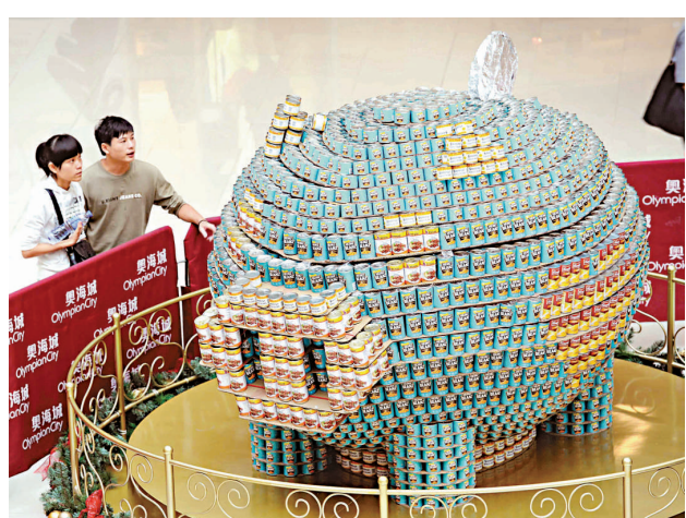
「愛心罐頭香港」活動昨日在奧海城揭幕。由多個建築師、工程師及設計師團隊利用超過24000罐頭食品組裝成7件巨型罐頭裝置，並限時12個小時內完成創舉。圖為活動中一個甚為趣致的豬形罐頭裝置。中通社

被告上月底已承認一項以欺騙手段取得金錢利益的罪名，昨晨在荃灣裁判法院被判社會服務令150小時，限1年內完成。裁判官考慮被告已認罪，且無犯罪紀錄，故作出輕判。有關案件被告於9月中辭職時，向人事部同事表明自己只有中三學歷希望繼續進修，從而遭到揭發。