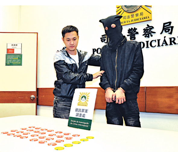
司警在路氹一賭場拘捕行使假碼的香港少年，行動中起獲28個假碼

澳門法例中的《規範進入娛樂場和在場內工作及博彩的條件》已於本月1日實施，禁止未滿21歲人士進入賭場。法例生效後5天，當局接報未滿21歲人士被拒入娛樂場個案有逾3000宗，另有19宗未滿21歲人士違規進入賭場，違規者可被罰款。