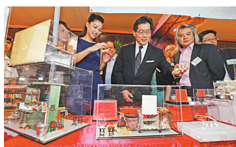
蘇錦樑（左）出席中西區旅遊節開幕禮，參觀攤位模型。

【本報訊】由中西區區議會舉辦的2012中西區旅遊節開幕禮昨晚舉行，旅遊節舉行期間，會在人來人往的中環至半山行人扶手電梯布置節日環保燈飾，亦會在連接中環環球大廈及上環信德中心的行人天橋，以旅遊景點為主題粉飾其身，把地區特色及節日氣氛由半山一直伸延至金融商業的中心地帶，整個畫面剛好形成一個「T」字，凸顯旅遊節「Tourism」的重點。昨日主禮的商務及經濟發展局局長蘇錦樑形容，中西區區議會在未來兩個多月會舉辦多項大型活動，全面提升市民及旅客在中西區旅遊的樂趣，正好配合旅遊局的「香港繽紛冬日節」活動，可謂互相輝映、相得益彰。