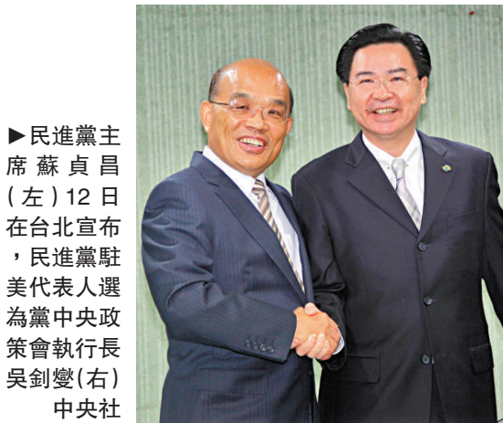
►民進黨主席蘇貞昌（左）12日在台北宣布，民進黨駐美代表人選為黨中央政策會執行長吳釗燮（右）

【本報訊】綜合中通社及中央社十二日報道：民進黨駐美代表處將設在華盛頓，目前辦公處所地點還在尋覓中。依循民進黨的慣例，吳釗燮未來不是常駐美國，而是以台灣為基地，平均2至3個月訪美1次。吳釗燮在民進黨執政時期，除曾任陸委會主委，也曾