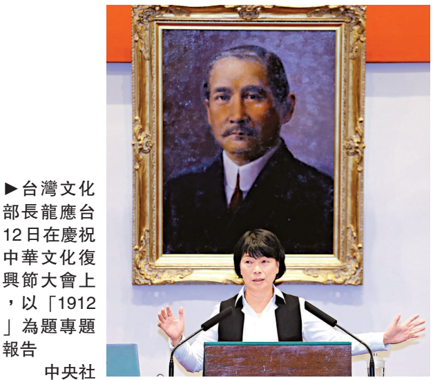
►台灣文化部長龍應台12日在慶祝中華文化復興節大會上，以「1912」為題專題報告 中央社

【本報訊】據中通社十二日報道：11月12日是孫中山先生誕辰紀念日，台灣文化部長龍應台應邀在紀念大會上發表「1912」專題演講，據與會者轉述，龍應台認為孫中山是位大夢想家，當時他的夢或許看來有些虛幻而不切實際，然而這100年來的發展，卻仍然向著孫中山的夢想前進。 據媒體報道，針對龍應台這次演講的「題目」，一度引發外界質疑。龍應台在演講中首先表示，她的演講題目原本就是「1912」，但後來覺得題目太大，因為「1912」講三天三夜都講不完，於是改了題目叫「孫逸仙這個人」，可是當時時間更接近時，她又想，她真正要講的東西，還是那個時代、那個氣氛、於是又把題目改回「1912」。 龍應台指出，1912年距今剛好是整整100年，到底那是一個什麼樣的時代？好幾代人談起1912年，都會說那當然是一個列強瓜分中國的時代。 龍應台從劍橋醫學院畢業的醫生伍連德談起、再談中國首名鐵路總工程師詹天佑、然後是孫中山。伍、詹、與孫三人都是廣東籍，龍應台以這三位當時南方出身的人物，以及從公共衛生與鐵路規劃兩條軸線，一窺整個中國面對現代化百年歷程。 她說，孫中山為了規劃全中國鐵路網，與澳洲顧問將中國地圖攤在地上，兩人席地而坐，譬如，從上海如何往北、往南，以及往西延伸，其中，一條鐵路一路拉到西藏拉薩。當時，孫中山規劃了超過16萬公里的鐵路網，但百年後的今年，中國大陸只有8萬公里鐵路。 龍應台說，孫中山是一位很有眼光的大夢想家，她以為，縱使當時看來那些夢想太過龐大而遙遠，但如今整個中國的走向，仍然一直朝著孫中山的夢想前進。