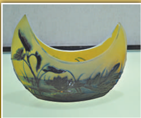
▲黃地蓮紋船形套料缸，艾米爾·加萊