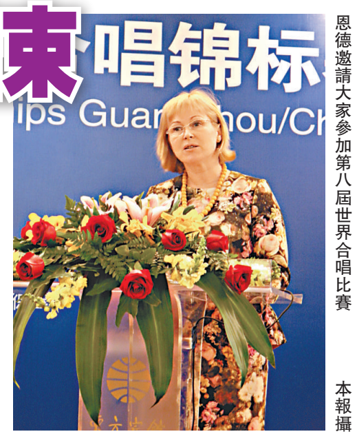
▲拉脫維亞共和國文化部長扎內特·瑞恩澤美·格蕾恩德邀請大家參加第八屆世界合唱比賽

組委會還舉辦了以「年輕歌者的世界」為主題的國際合唱文化交流峰會，國內外合唱知名指揮家、作曲家、歌唱家、社會活動家應邀出席，他們結合自己的工作領域和豐富的經驗，就如何促進兒童和青少年在合唱音樂中的成長和發展，為成長中