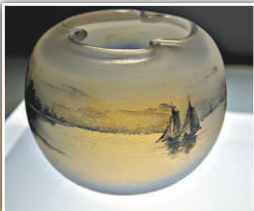
▲白地彩繪風景瓶，道姆