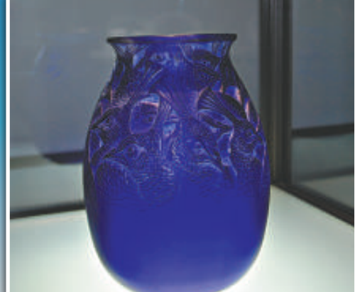
▲藍色孔雀紋瓶，萊利克