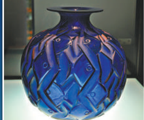
▲藍色魚紋瓶，萊利克