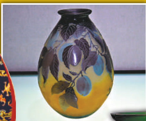
▲浮雕花瓶系列，艾米爾·加萊