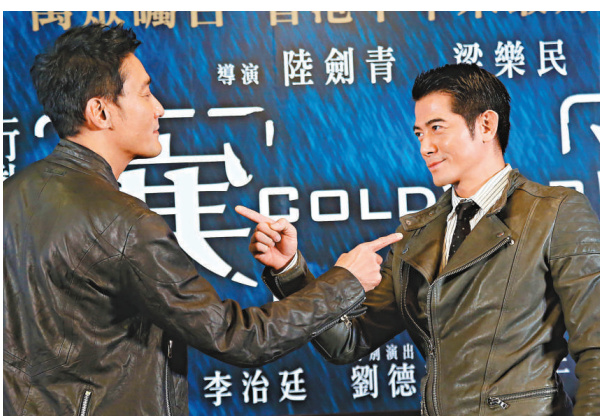
▲城城（右）與家輝惺惺相惜

該片首周在香港上映就有好成績，郭富城和梁家輝再度被看好問鼎明年的影帝寶座。郭富城在去年9月為了準備演唱會，原本不打算接拍這齣電影，但是他看到劇本後愛不釋手，最終接拍。梁家輝今次飾演警官，他說：「演這樣的戲要很大的能量，很開心能夠跟郭富城合作。」