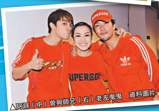
▲阿詩（中）曾與師兄（右）老友鬼鬼