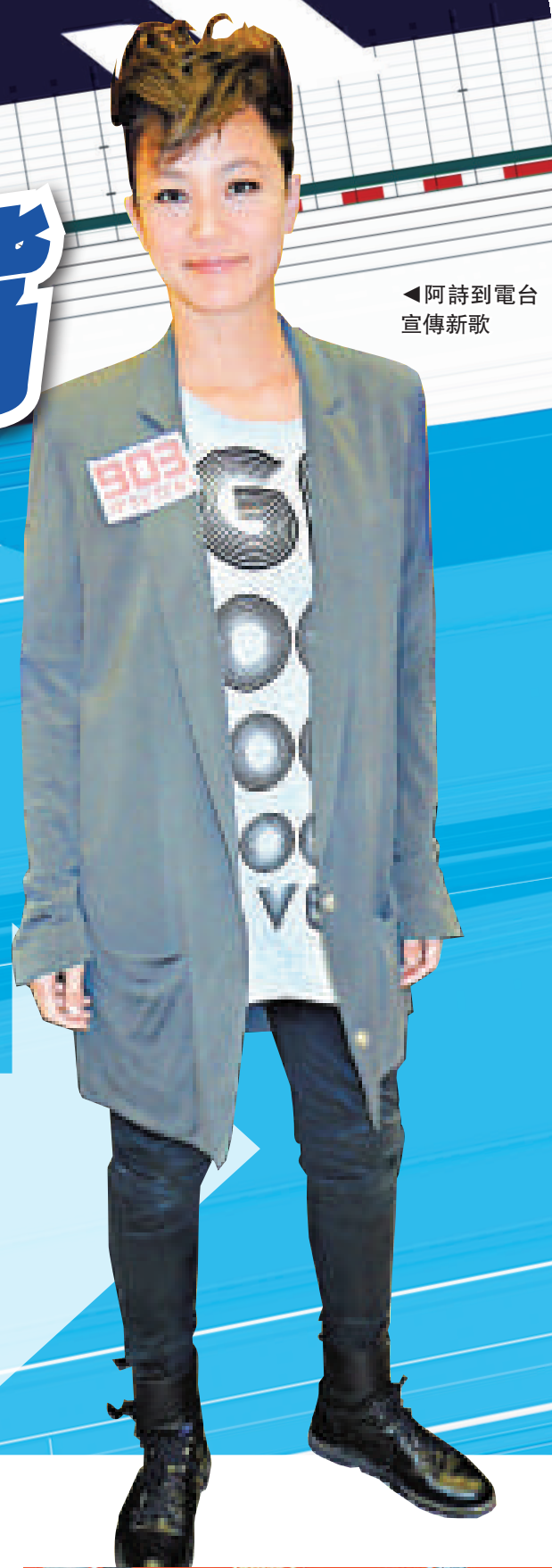
◀阿詩到電台宣傳新歌