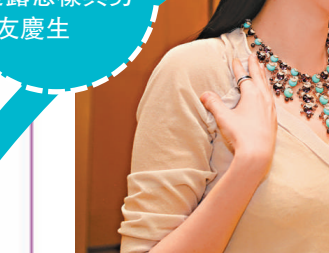
▲Baby拒透露怎樣與男友慶生