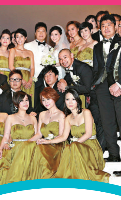
▲嘉樂、盈盈與兄弟姊妹團來張大合照