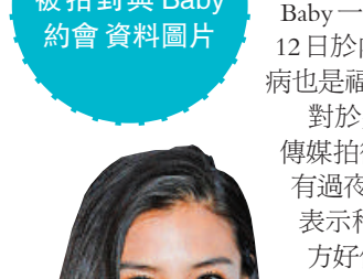
▲Baby拒透露怎樣與男友慶生