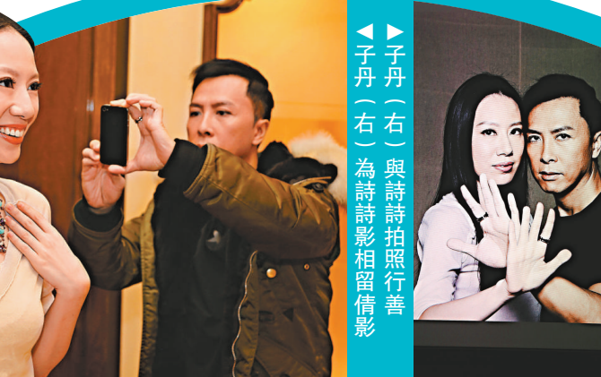
▲子丹(右)與詩詩(左)為詩詩影相留倩影