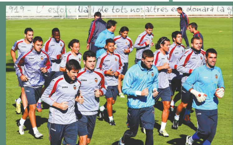
▲華倫大軍一絲不拘備戰

拜仁陣容（4-4-2）：門將：1紐亞；守衛：4丹迪、17謝路美保定、28畢斯杜巴、16拿姆；中場：25湯馬士梅拿、11梳頓沙基利、44泰摩斯卓克、31舒韋恩史迪加；前鋒：9文迪蘇傑、39卻奧斯。