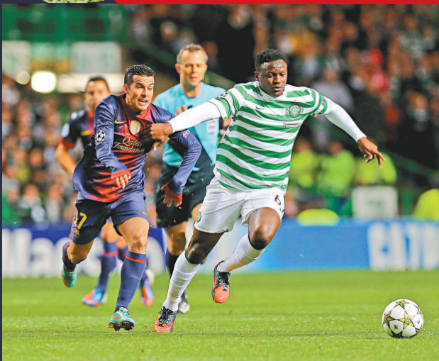
成名►些路迪的雲耶馬（右）在打敗巴塞一戰