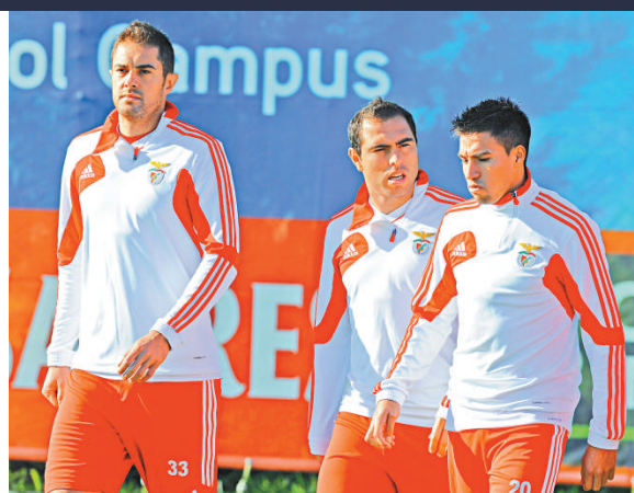
▲賓菲加球員一臉嚴肅備戰

【本報訊】綜合外電葡萄牙十九日消息：可一，當然希望可再，上輪爆大冷殺敗巴塞隆拿的蘇超班霸些路迪，周二晚或希望重複氣走巴塞的方程式，在歐聯G組關鍵戰作客出門葡超賓菲加時務求悶死對手，故此宜買入球大細的「細」。（足智彩今仗總入球細有2.1倍）（有線63及高清203台香港時間周三凌晨3時45分直播）