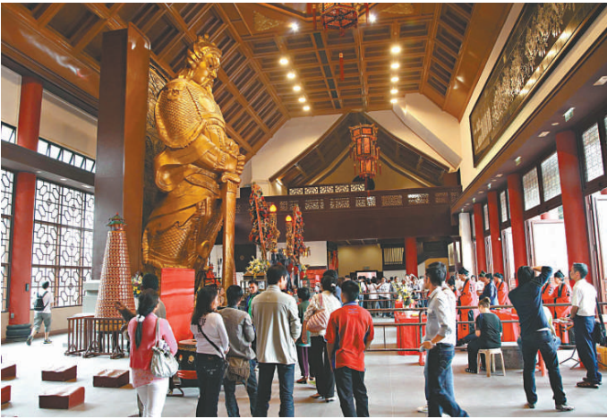
車公廟大殿經過翻新後，豁然開朗

華人廟宇委員會直轄的廟宇中，以沙田車公廟的香火最盛。該會耗資近二千萬元進行此項翻新工程，歷時五年之久，近日正式完工，並舉行廟會慶祝，還邀請蓬瀛仙館的道長在殿內主持禮斗科儀，展示一個道教與民間宗教融合的場面。