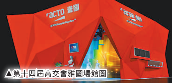
▲第十四屆高交會雅圖場館圖

媒體這三個領域，在本次高交會上，雅圖極盡運用場館的空間向人們展示了這三個領域的前沿技術。作為此次展示的主要亮點之一，它以BOX為載體，從不同的角度搭載四台雅圖LX8100投影機，通過系統內的指定PC來控制投影機的啓動和畫面亮度，實現多角度觀看的立體效果。