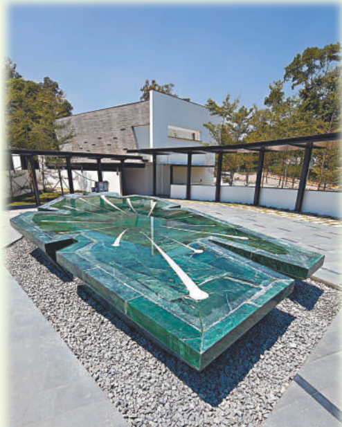
和合石「生命之泉」的氣泡由池底不斷冒起、緩緩上升，象徵生命的希望和重生，撫慰哀傷的吊唁者。

除了海葬，本港現時亦有八個紀念花園供市民作花園葬，地點為歌連臣角、鑽石山、富山、葵涌、和合石、長洲、南丫島及坪洲。花園葬本