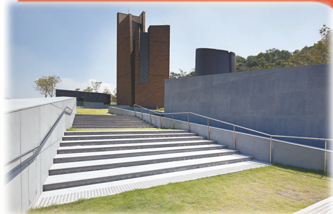
▲粉嶺和合石火葬場的斜面草坪可讓吊唁者散步，平服心情後才離開