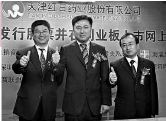
▲紅日藥業解禁當天,股東高管們便迫不急待地減持。圖為公司上市時情景

曹鳳岐認爲其癥結在於,「中國資本市場現在存在制度性問題」。他表示,這個市場是爲融資者設計的,而不是爲投資者設計的。二十多年來,很多企業從資本市場拿走了很多錢,但投資者在這個市場上回報甚低,因此這個市場則成爲了「圈錢」市場。對於解決方法,曹鳳岐建議,一要加強信息披露制度建設。上市公司要給投資者一個明確、詳細、正確的信息,讓投資者判斷是否值得投資,對虛假披露、內幕交易等嚴厲打擊;二要繼續改革股票發行和交易制度。交易首日進行漲跌停板限制,發行價漲15%就停牌,最後三分鐘不能放開;三要建立公平合理的分紅制度。中國的上市公司,非常公平的公司不懂得分紅,或者是不想分紅,「而強制性分紅政策出台後的分紅也是象徵性分紅。」四是完善退市制度。