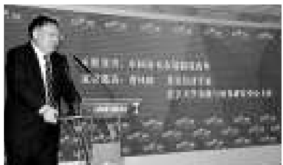
▲曹鳳岐呼籲加強資本市場制度建設

【本報記者蔣敏、楊家軍鄭州報道】北京大學金融與證券研究中心主任曹鳳岐二十三日在第八屆大河財富(中國)論壇上表示,中國資本市場現急需加強信息披露制度、改革發行與交易制度、建立合理的分紅制度及完善退市制度。