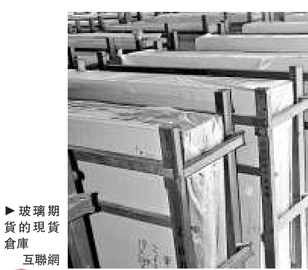
►玻璃期貨的現貨倉庫 互聯網

鄭州商品交易所昨日發布公告稱,為確保場內席位與遠程席位在增加玻璃期貨合約後下單、撤單、成交回報、各種查詢及行情顯示等功能的正確性,該交易所決定於二〇一二年十一月二十七日,以及玻璃期貨上市前一個交易日閉市後進行交易系統測試。