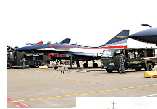
▲在第九屆中國國際航空博覽會上，7架停泊在停機坪的中國空軍殲10引起關注 資料圖片