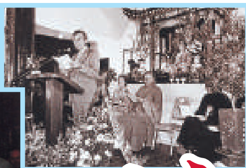
◀鍾逸傑以官員身份在寺廟的開幕儀式上發言

◀1984年鍾逸傑在北京出席中華人民共和國35周年國慶典禮，左起：鍾士元、羅保、沈弼、鍾逸傑、魯平和夏鼎基