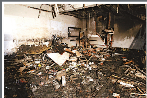
▲爆炸現場滿地狼藉

他還說，爆炸時，正好有騎自行車的人路過火鍋店，巨大的衝擊將人和車衝擊到馬路對面，人撞到對面商舖的捲閘門上摔了下來，自行車車輪與車身分離。在警戒線內，記者看到了散架的自行車部件和被撞毀的捲閘。