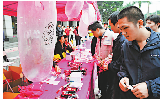
▲深圳疾控中心在富士康龍華廠區派發避孕套

【本報訊】24日晚，由深圳市防治愛滋病工作委員會辦公室、深圳市人口計劃生育委員會主辦，深圳市疾病預防控制中心承辦的「防艾不防愛」2012年世界愛滋病日大型主題宣傳活動在富士康龍華廠區舉行。據深圳市疾控中心統計數據顯示，今年1-9月，報告愛滋病病毒（HIV）感染者987宗，比去年同期上升15.3%，死亡病例41宗。晚會以歌舞、小品、相聲等形式宣傳防治愛滋病理念，共同關愛來深建設者，一起行動向「零」愛滋邁進。（中新社）