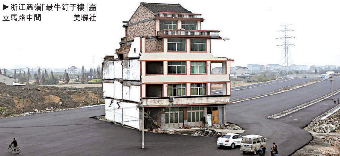
▶浙江溫嶺「最牛釘子樓」矗立馬路中間

【本報訊】24日晚，由深圳市防治愛滋病工作委員會辦公室、深圳市人口計劃生育委員會主辦，深圳市疾病預防控制中心承辦的「防艾不防愛」2012年世界愛滋病日大型主題宣傳活動在富士康龍華廠區舉行。據深圳市疾控中心統計數據顯示，今年1-9月，報告愛滋病病毒（HIV）感染者987宗，比去年同期上升15.3%，死亡病例41宗。晚會以歌舞、小品、相聲等形式宣傳防治愛滋病理念，共同關愛來深建設者，一起行動向「零」愛滋邁進。（中新社）