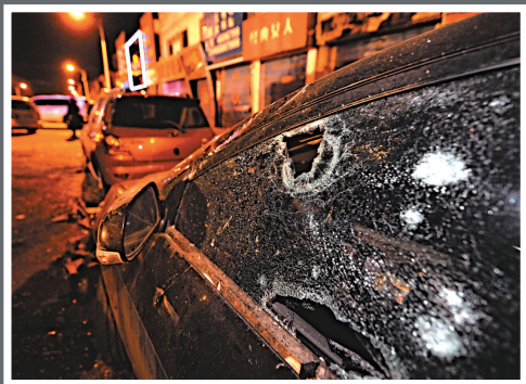
▲火鍋店對面一輛汽車的玻璃被擊破