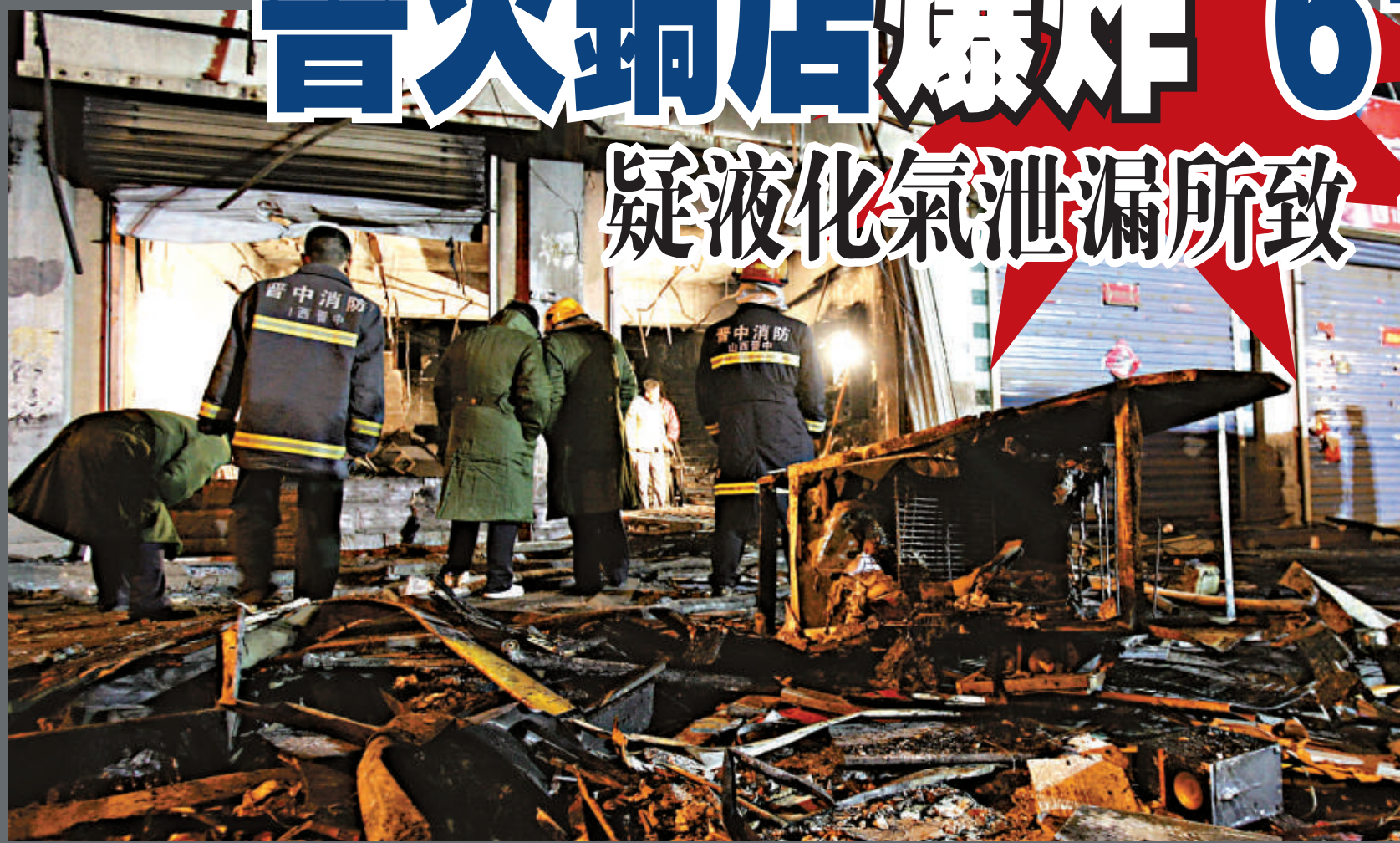
▲山西晉中市壽陽縣喜洋洋火鍋店23日晚疑液化氣泄漏引發爆炸並發生大火，消防官兵撲滅大火後在處理現場

【本報訊】山西晉中市壽陽縣一家火鍋店23日晚發生爆炸事故，截至24日下午，已造成14人遇難，47人受傷，全部傷者送往醫院救治。縣政府稱，事故起因初步判斷為液化氣泄漏所致，已對所有使用液化氣的餐館飯店進行集中整治。