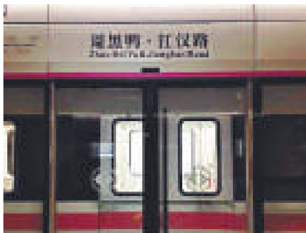
▲本月中旬，有市民曝料稱武漢地鐵站被冠以「周黑鴨·江漢路」站，引發熱議