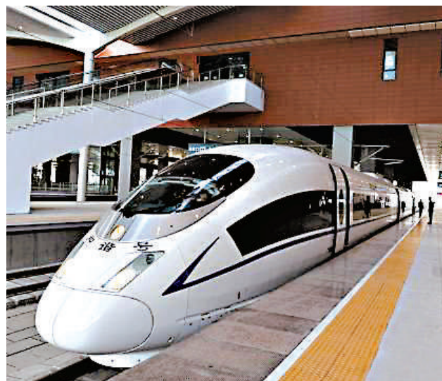
▲哈大高鐵試運行採用了中國北車製造的CRH380B型高寒動車組列車，同時增強了抗惡劣天氣能力

作為武漢市著名的百年老街江漢路，與經營鴨類食品的企業聯繫在一起，此舉引發當地民衆諸多爭議。不少人在網絡上表示，「周黑鴨」等企業冠名地鐵的做法太商業化，「有傷大雅」。不過，也有市民則表示，知名企業冠名地鐵站並無不妥，相反可以擴大企業影響力和知名度。