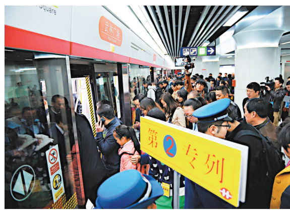
▲乘客排隊乘坐杭州地鐵1號線列車 新華社

進入21世紀以來，中國的地鐵設施建設開始迅速升溫。除最早開通地鐵的北京、天津、上海、廣州、台北、香港「資深組」外，其他如南京、瀋陽、成都、武漢、重慶、深圳等城市均已開通地鐵。