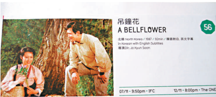
▲第12屆香港亞洲電影節小冊子

第12屆香港亞洲電影節選放的另一部朝鮮電影是1987年的《吊鐘花》，攝於金日成時代。影片把女主角比喻成在惡劣環境下綻放色彩的吊鐘花，讚揚她堅守崗位，犧牲小我，默默為國家作出貢獻。故事講述女主角與愛人熱戀，因兄妹反對而作罷。後來男主角因貪圖城市的美好生活而離開鄉村，要求女主角跟他同住，她拒絕，以後悲痛不已。後來女主角為建設鄉村而傾盡全力，鄉民在她的感召和帶領下變得萬眾一心，使鄉村逐步邁向現代化。最後女主角在暴風中為搶救一頭幼羊而犧牲性命。另一方面，男主角在城市生活欠佳，於是帶同兒子返回故鄉，得知舊愛去世後，悲痛欲絕，並深深懷恨以往的所作所為。電影的主題呼之欲出：人民不應嫌棄國家窮困，不應因嚮往外國的富裕生活而捨棄國家，應默默耕耘，為國家的現代化作出貢獻。