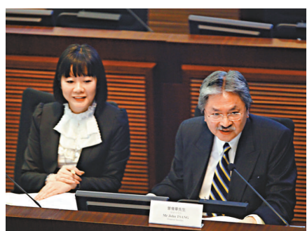
▲曾俊華(右)表示，遏樓價辣招初見成效，樓市成交縮減。旁為陳李蔭倫

曾俊華昨日到立法會財經事務委員會簡報本港經濟情況時表示，歐美日三個地區的中央銀行，在9月都推出新一輪量化寬鬆措施，令本地樓市更趨亢奮，政府分別在8月和9月公布措施，增加土地和住宅供應，以及防止按揭貸款過度增長。而10月再推出加強版的「額外印花稅」，以打擊投機活動，以及向所有香港永久性居民以外的其他買家開徵「買家印花稅」，以確保在供應緊縮的情況下，本地居民的置業需要可以得到優先照顧。