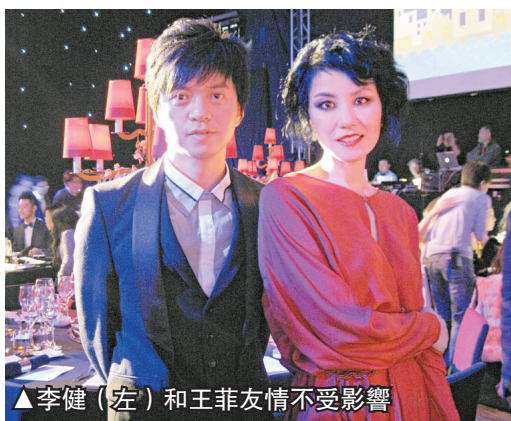
▲李健(左)和王菲友情不受影響