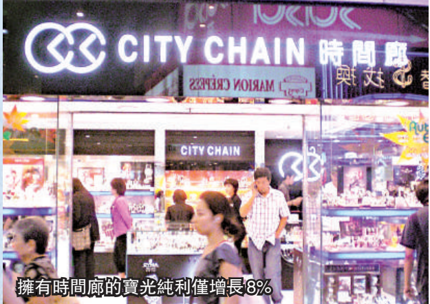
擁有時間廊的寶光純利僅增長8%