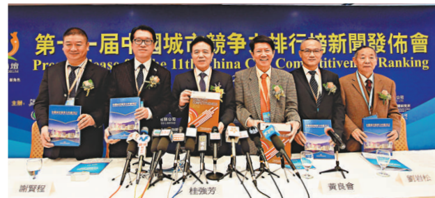
▲中國城市競爭力研究會昨天在港發布第十一屆中國城市競爭力排行榜

不過，在2012中國最安全城市排行榜中，本港連續第二年未能上榜。桂強表示，人命傷亡事故是評分準則之一，本港10月時發生的港燈撞船事故，造成多人傷亡，令本港安全評分下降。