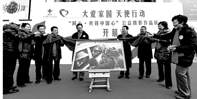
▲中國紅十字會委任16人對該會進行監察。圖為北京市紅十字基金會10日在王府井步行街舉行公益攝影作品展

據介紹，社會監督委員會成立後將從三方面開展監督，包括捐贈款物的管理和使用情況，引起媒體和社會公眾質疑的事項，以及對其他特定事項進行監督。（新華社）