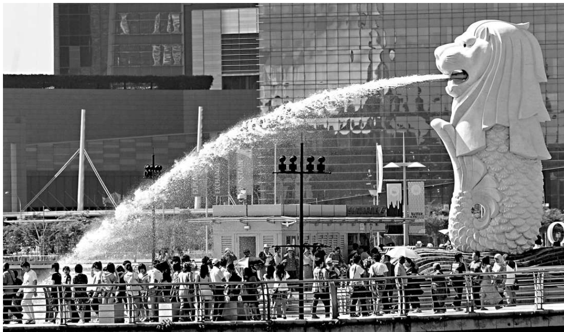
▲廣州大坦沙島地區改造規劃將引入新加坡發展概念，目標是十年內打造成國際級的花園島嶼 資料圖片

根據廣州市大坦沙島地區控制性詳細規劃的要求，依託大坦沙島優越的地理位置和資源特點，規劃將大