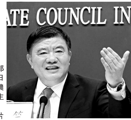
▲衛生部部長陳竺10日當選中國農工民主黨主席 資料圖片

【本報訊】據中新社北京十日消息：中國農工民主黨第十五屆中央委員會第一次全體會議10日選舉產生了由51人組成的第十五屆中央常務委員會，59歲的現任中國衛生部部長陳竺當選主席。