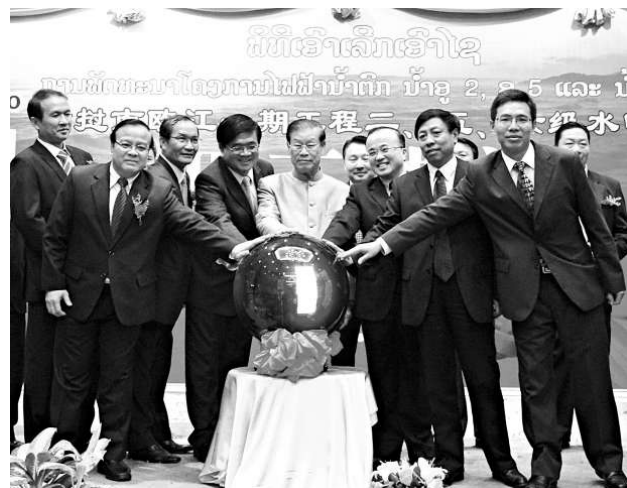
▲老撾政府副總理凌沙瓦（左五）、中國駐老撾大使館臨時辦吳志武（右三）、經濟商務參贊趙文宇（右一）等嘉賓10日出席開工儀式

據統計，1996年以來，廣西耕地面積快速減少，已由1996年的440萬公頃減為目前的421萬公頃，低於全國平均水平。廣西自治區環保廳副廳長鍾兵表示，推進形成主體功能區就是為防止過度佔用耕地，保障農產品供給安全，為珠江下游提供牢固的生態保障。