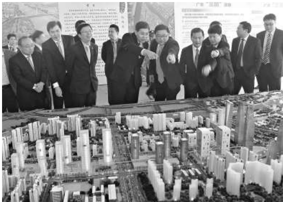
▲廣州荔灣區相關職能部門與新加坡對口機構代表，聽取大坦沙島地區改造規劃

坦沙島定位為「國際化的花園島嶼，現代服務業新業態地區，具嶺南西關文化風情的商貿、文化、居住、旅遊區」。在「廣新合作」的政策背景下，引進國際開發公司參與全島策劃、開發和管理，並邀請國際知名設計師參與全島城市設計工作，高標準、高起點對大坦沙島進行科學規劃。