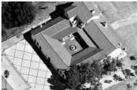
▲▼涉嫌非法經營雙非孕婦中心的加州奇諾縣一間住宅，下圖為屋內的VIP房