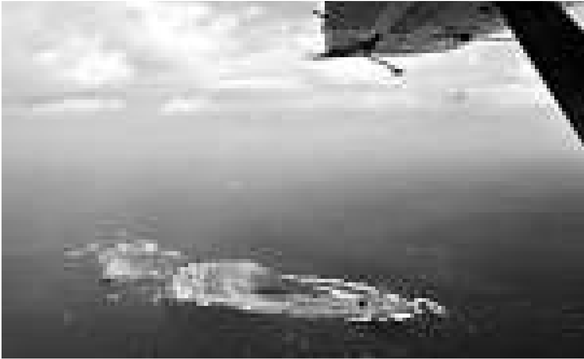
▲13日10時，中國海監B-3837飛機抵達釣魚島領空巡航 新華社