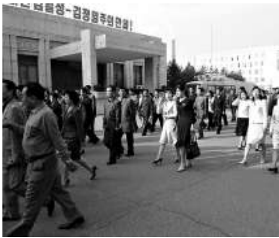
▲衣着鮮亮的朝鮮人

另一方面，在國際社會空前孤立下，朝鮮向中國進口越來越多的商品，對華依存度不斷上升。海關數字顯示，2011年中朝貿易總額達56.3億美元，同比增加62.4%，佔朝鮮總體貿易比重近九成。今年上半年，中國對朝出口達18.37億美元，再創新高。一名身在韓國的朝鮮問題研究專家說，朝鮮目前