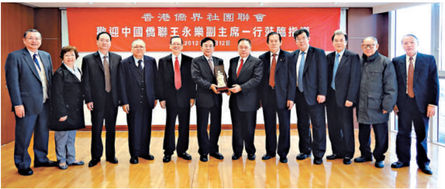
▲中國僑聯王永樂副主席（左六）與余國春（左七）、陳有慶（左五）等合影

【本報訊】日前，中國僑聯副主席王永樂一行4人在訪港期間專程蒞臨香港僑界社團聯合會會所，與該會會長余國春、主席陳有慶、常務副會長陳金烈、副會長王欽賢、黃周娟娟等座談。王永樂副主席是香港僑界的老朋友，余國春會長代表該會全體同仁向王永樂副主席一行蒞臨指導工作，表示誠摯歡迎和衷心感謝。