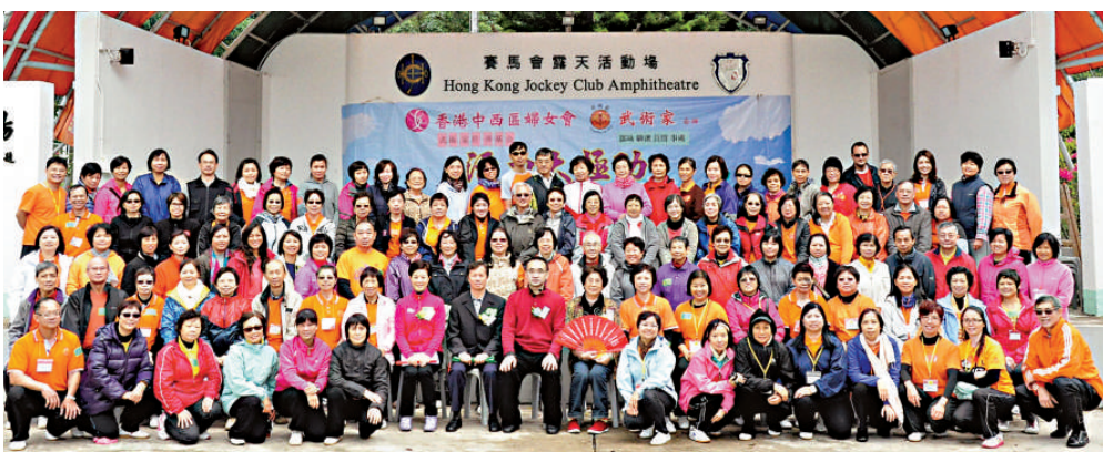
▲「活力太極功」戶外學習體驗營主要負責人與學員合影

起，在大自然中享受太極功所帶來的正能量。活動當日雖時有小雨，卻絲毫不減大家的熱情，大家身著輕便的雨衣，演練着坐式「活力太極功」，認真整齊地完成每個招式，雨衣隨着身體的擺動，發出颯颯之聲，伴着口令與音樂，奏出它那獨特的活力樂章，整個運動場面甚為壯觀。