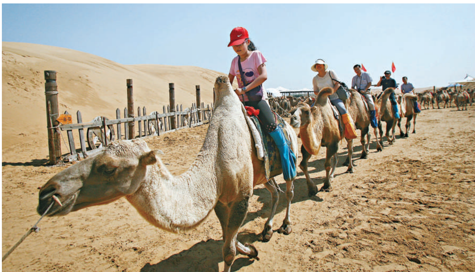
▲遊客騎着駱駝前行

讓當地牧民感到欣慰的不僅是傳統駱駝文化復蘇帶給他們的喜悅，更高興的是能讓他們致富奔小康的養駱業興旺發展。「內蒙古的雙峰駱駝數量佔全國的60%左右，從長遠講，要保護阿拉善雙峰駱這一優良畜種和合理的種群數量，還需要進一步開發駱駝產品，提高養駱的經濟效益。阿拉善雙峰駱作為世界稀有動物之一，其可利用資源對於人類生活有很大的幫助。而駱駝產業作為內蒙古沙產業的一項富民、綠富同興的新項目，只要將文化傳統與高科技有效對接，實施名牌帶動和產業聯動結合，就會使駱駝產業的核心競爭力大大增強。今後，駱駝要走「綠化——轉化——產業化」的特色道路，從種草、種灌木、養良種駱，到利用駱駝全身的寶，延伸出駱駝加工業、駱奶加工業、旅遊業以及駱骨工藝等眾多產業。把駱駝產業從原料、加工到深加工、精加工產品，走特色化品牌道路。」康凌雲堅定地說。