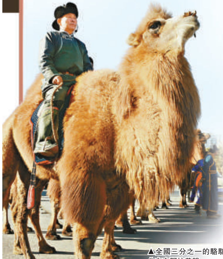
▲全國三分之一的駱駝分布在阿拉善盟

駱駝雖然體形高大，但奔跑起來卻是電掣風馳。比賽時，賽手不分男女，身着艷麗的參賽服騎在駱背上，在起跑線排成一列。當裁判員發令後，眾騎手揮鞭驅馳駱駝疾跑。賽程一般為3至5公里，以先到達終點者為勝。由於駱駝生性乖張，桀驁不馴，因而參加比賽的駱駝必須經過長期調教，徹底馴服後方可上場。參加比賽的駱駝會被佩戴上五彩的籠頭，當所有賽手騎駱駝在荒漠草原或戈壁上升起飛奔起來時，場面更是壯觀無比。此外，還有搓毛繩比賽和擠駱奶比賽也頗具趣味性。