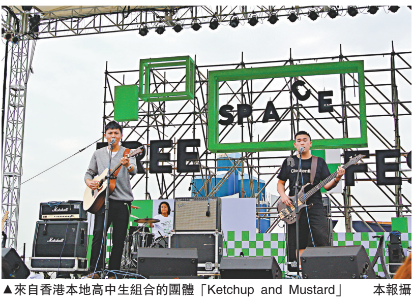
▲來自香港本地高中生組合的團體「Ketchup and Mustard」