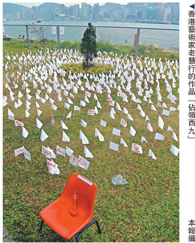
▲香港藝術家老慧行的作品「佔領西九」