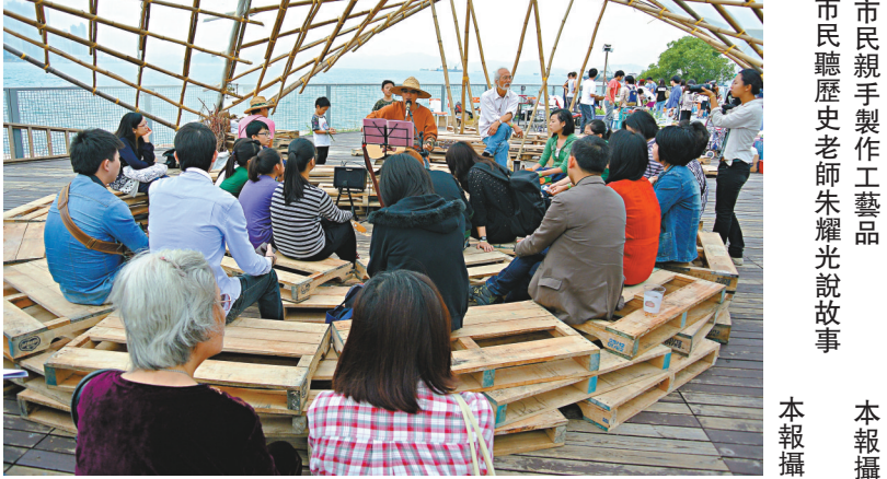
▲市民親手製作工藝品

【本報訊】記者周怡報道：由香港當代文化中心重點項目MaD (Make a Different創不同)與西九文化區管理局主理的「自由野」，上周六及昨日在西九龍海濱長廊舉行了多場以音樂、舞蹈、戶外演出、藝術展、工作坊及手工集市為主的實驗文化自由空間，與市民展開了自由叫、自由唱、自由玩的文化探索之旅。