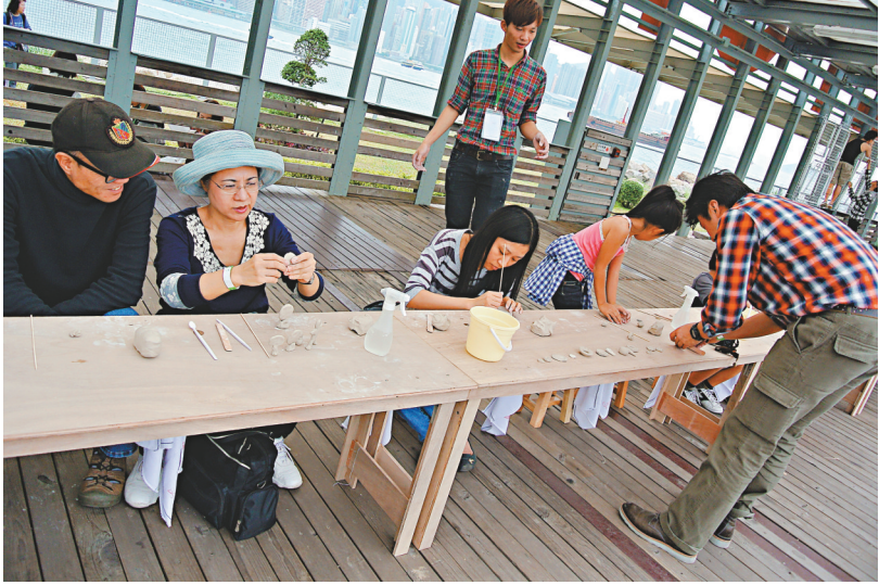
▲市民親手製作工藝品