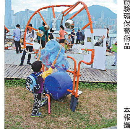
▲孩童體驗環保藝術品

曾於今年年初舉辦的「MaD@西九」，以空間自由、文化自由、人人自在為大前提。沿着「自由野」這個主題方向，MaD以公眾參與、多元性及開放的態度，為未來的西九龍及自由文化空間進行實驗，通過音樂、舞台、藝術設計、工作坊等各類活動，為大眾提供更多文化藝術生活體驗。詳情可瀏覽網站www.freespace.hk。