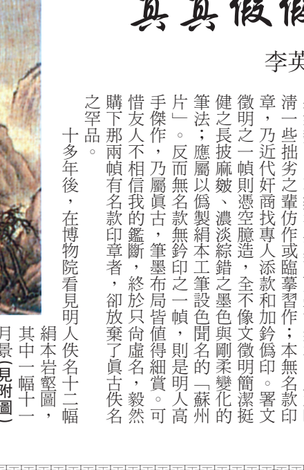
一位喜歡收藏的友人展示三幅古網畫，說俱屬明代畫家手筆。其中一幅山水畫並無作者署名或任何款識、題跋與印章；而另外兩幅山水畫分別署沈石田和文徵明，下鈐幾方印章。友人請我幫幫眼：不過細察下，深感筆墨不免刻板呆滯，尤其署名沈石田一頓，毫無沈石田渾厚質實筆墨，以及蒼石奇肆氣勢，山石皴法與點苔更難亂真，應為晚清一輩拙劣之輩仿作或臨摹習作；本無名款印章，乃近代奸商找專人添款和加鈐偽印。署文徵明一頓則懸空臆造，全不像文徵明簡潔挺健之長披麻皴、濃淡綜錯之墨色與剛柔變化的筆法；應屬以偽製網本工筆設色開名的「蘇州片」。反而無名款無鈐印之一頓，則是明人高手傑作，乃屬真古，筆墨布局皆值得細賞。可惜友人不相信我的鑑斷，終於只向虛名，毅然購下那兩幅有名款印章者，卻放棄了真古佚名之罕品。