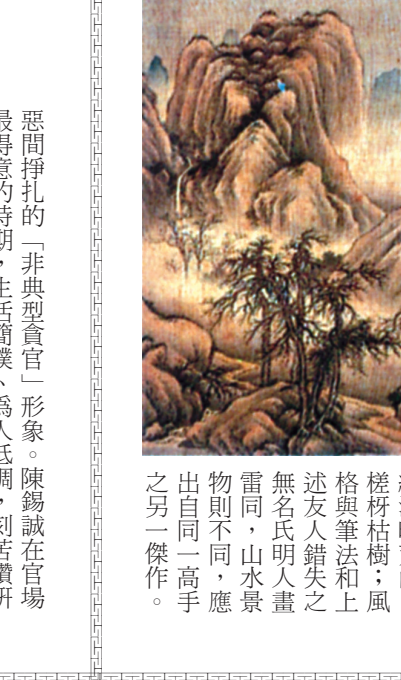
繪清曠荒山、格致枯樹、風搖與筆法和上迷友人錯失之無名氏明人畫雷同，山水景則不同，應出自同一高手之另一傑作。

三十多年前，一名畫商向一位喜歡收藏的友人展示三幅古網畫，說俱屬明代畫家手筆。其中一幅山水畫並無作者署名或任何款識、題跋與印章；而另外兩幅山水畫分別署沈石田和文徵明，下鈐幾方印章。友人請我幫幫眼：不過細察下，深感筆墨不免刻板呆滯，尤其署名沈石田一頓，毫無沈石田渾厚質實筆墨，以及蒼石奇肆氣勢，山石皴法與點苔更難亂真，應為晚清一輩拙劣之輩仿作或臨摹習作；本無名款印章，乃近代奸商找專人添款和加鈐偽印。署文徵明一頓則懸空臆造，全不像文徵明簡潔挺健之長披麻皴、濃淡綜錯之墨色與剛柔變化的筆法；應屬以偽製網本工筆設色開名的「蘇州片」。反而無名款無鈐印之一頓，則是明人高手傑作，乃屬真古，筆墨布局皆值得細賞。可惜友人不相信我的鑑斷，終於只向虛名，毅然購下那兩幅有名款印章者，卻放棄了真古佚名之罕品。 十多年後，在博物院看見明人佚名十二幅絹本岩壑圖，其中一幅十一月景(見附圖)繪清曠荒山、格致枯樹、風搖與筆法和上迷友人錯失之無名氏明人畫雷同，山水景則不同，應出自同一高手之另一傑作。