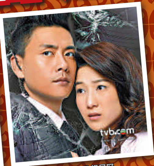
▲《護花危情》全年收視居冠