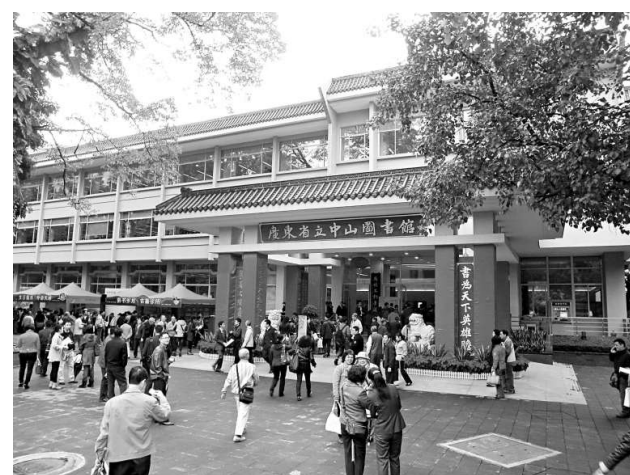
▲廣東省立中山圖書館迎來百年華誕，大批市民前來慶祝

杭州地鐵一號線十一月二十四日開通，全長四十七點九七公里，是中國地鐵城市首條開通線路中最長的一條。該工程概算投資二百四十點六億元，亦是杭州城建史上投資規模最大的基礎設施項目。