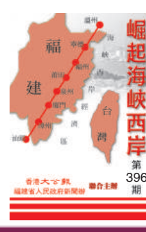
崛起海峽兩岸 第396期