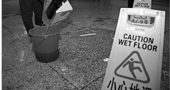
▲杭州地鐵頻遭「水禍」，武林廣場B出入口十一日地面發生冒水，現場的地面和天花板都有不同程度的滲水現象。圖為清潔工人清理滲水