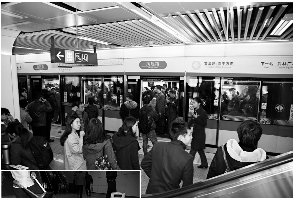
▲杭州地鐵鳳起路車站往文澤路方向列車十六日設備故障停運三十分鐘，由於事故不斷，原因又說法不一，令民眾心存憂慮

事故不斷，原因又說法不一，杭州地鐵令當地民眾心存憂慮。在早期建設時，地鐵還發生過坍塌事故