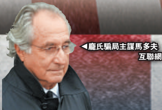
▲龐氏騙局主謀馬多夫 互聯網