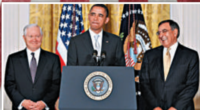
▲蓋茨（左）與美國總統奧巴馬（中）及前防長帕內塔

2009年，時任美國駐阿富汗最高軍事指揮官的麥克里斯特爾提出的大規模增兵要求令奧巴馬大吃一驚。他寫道，我認為奧巴馬和他的顧問被激怒了，他們認為軍方從他們手中奪取了政策制定的控制權，並可能不受約束。