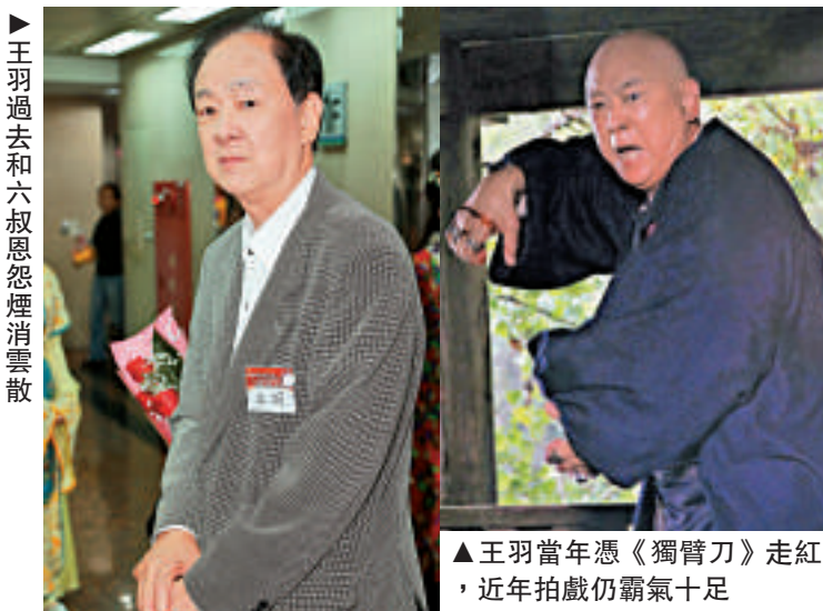
▶王羽過去和六叔恩怨煙消雲散