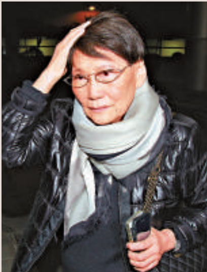
▲六孀心情逐漸平靜