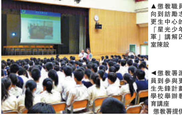
懲教署派員到參與更生先鋒計劃學校舉辦教育講座