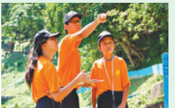
訓練營鞏固學生奉公守法意識