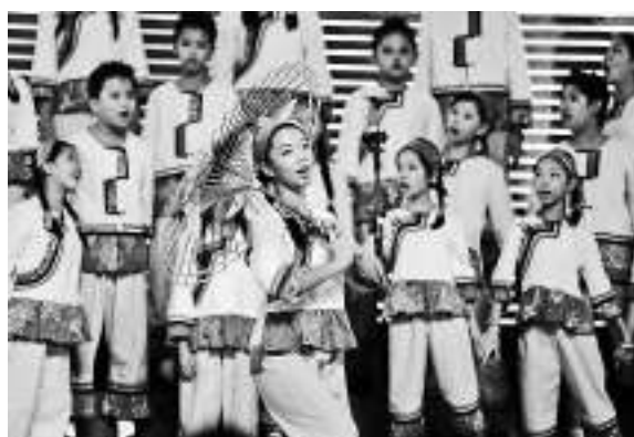
▲台灣豐田國民小學在海峽論壇上演民俗歌舞 本報資料