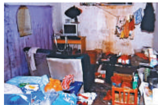
◀圖為央視播出的囚禁性奴地窖畫面截圖

2011年9月，河南洛陽警方偵破了一件離奇大案，案犯李浩在地下室挖地窖，先後囚禁6名女子當性奴，期間兩名女子被殺害。根據洛陽市中級人民法院作出的一審宣判，被告人李浩被判處死刑。宣判後，李浩提出上訴。河南省高級人民法院經依法開庭審理，於2013年8月5日作出裁定，駁回上訴，維持原判，並依法報請最高法院核准。最高法院依法組成合議庭，核准了李浩死刑。