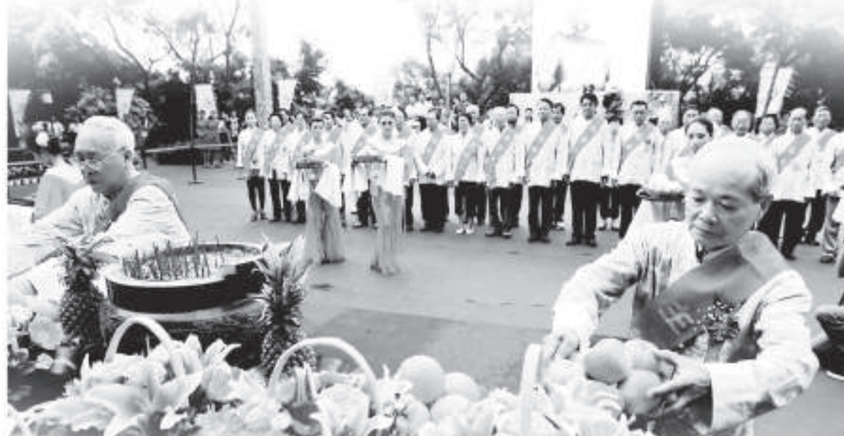
▲兩岸人士循古禮祭奠民族英雄鄭成功 資料圖片

合作經濟等與農村建設相關的人才的支撐，沒有這些農業員和農業技術官僚，合作社就無法運作。而台灣是一直有技術職業學校培養農業人才的。也就是說，無農業組織體系，即無富強的農村；而無農業技術人才，則無農業組織體系。