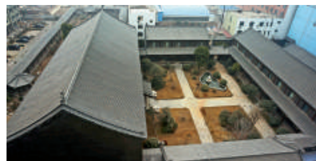
▲谷俊山在河南的豪華住宅 資料圖片

深圳交委人士認為，深圳定制公交服務需求並不匱乏，但能否真正落地，相當程度上取決於定價能否取得突破。業界認為，定制公交上線後，應被視為特殊品種實行完全市場化自負盈虧，還是依舊享受公共交通行業的財政補貼，或將引發爭議。