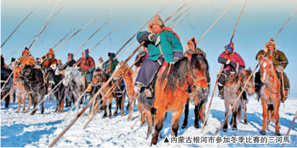
▲內蒙古根河市參加冬季比賽的三河馬

，方圓百里以至幾百里的牧民驅車、乘馬趕來聚會，參加賽馬活動。賽馬場上，彩旗飄飄，鼓角長鳴，熱鬧非凡。比賽時，無論男女老少均不備鞍轡，不穿靴襪，身着綵衣，頭束紅綠綢飄帶。比賽時，在眾人的歡呼聲中揚鞭策馬，競相追趕，觀看者歡呼鼓掌、跺腳助威，先到達終點者為優勝。賽馬結束時，獲獎的馬匹和騎手要並排列隊於主席台前，先由專人在台上唱頌讚馬詞，接着向名列榜首的駿馬身上撒奶酒或鮮奶。