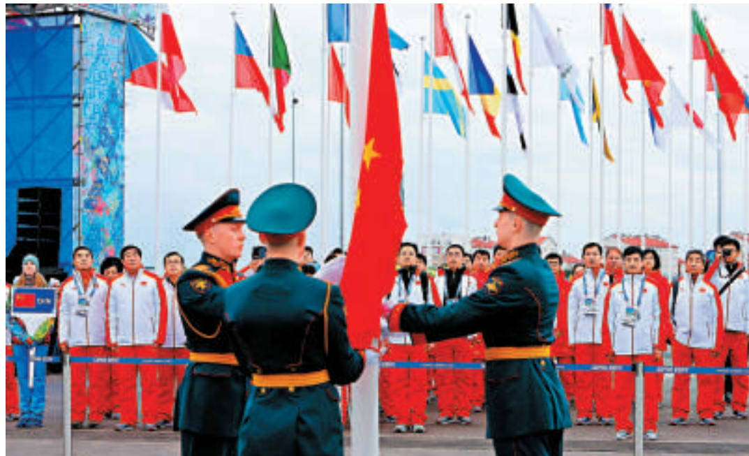
▲5日，中國體育代表團在索契海濱奧運村舉行升旗儀式 新華社

在2013年，中俄關係在各方面都取得長足發展，2014年將延續這一良好勢頭，為中俄關係的發展錦上添花。正如習近平去年底在致普京的新年賀電中所說，「高水準、強有力的中俄關係是我們兩國人民的福音，也是世界人民的福音」。在雙方的共同努力下，中俄兩個偉大鄰國間的友好合作必將不斷呈現新亮點，結出更加豐碩的果實。 （新華社）