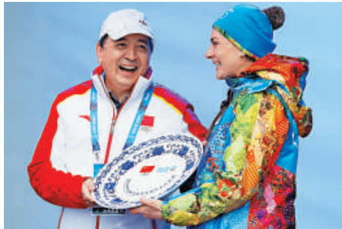
▲中國體育代表團副團長肖天（左）與伊辛巴耶娃互送禮品

在運動員餐廳設立的留言本上已有用各種語言表達獲勝或是尋求友誼的文字，其中也有不少中國運動員寫下的漢字，其中一頁寫着：「順其自然，失之坦然，爭其必然，中國運動員的信心、勇氣和平和心態躍然紙上。」