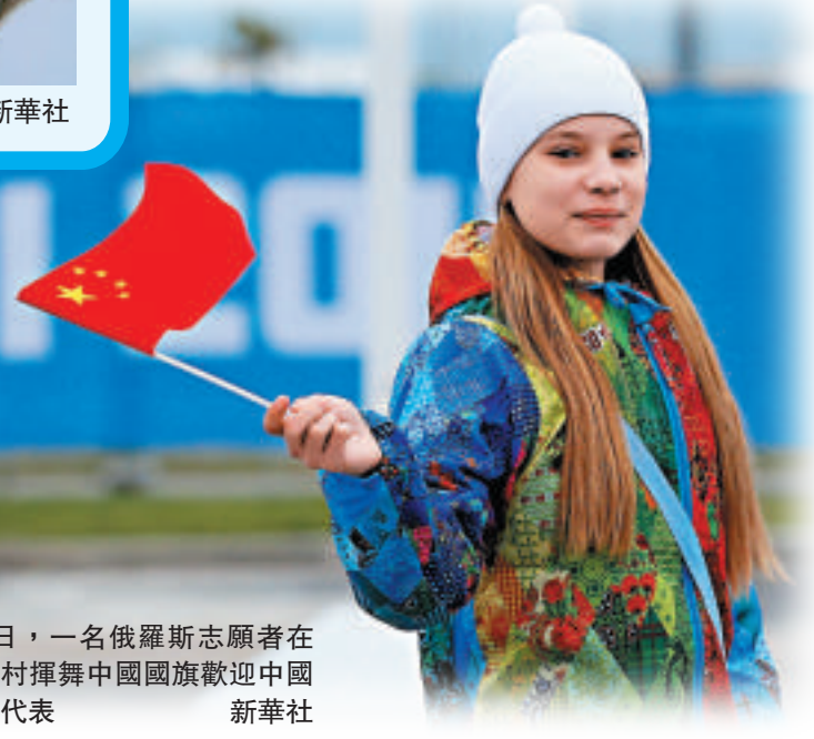
►5日，一名俄羅斯志願者在奧運村揮舞中國國旗歡迎中國體育代表

亞洲時事評論網站「外交官」發表評論稱，習近平參加冬奧會開幕式一方面體現了中國對俄羅斯的政治支持和友好態度，另一方面也展現出中國正越來越多地參與國際體育活動，增強國家在公共外交和體育外交領域的競爭力。