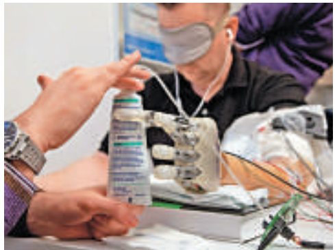
◀▲ 戴上仿生手的瑟倫森能夠分辨硬度的物體