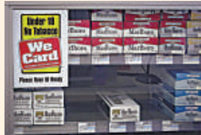
◀▲ 美國第二大連鎖藥店CVS將停售香煙