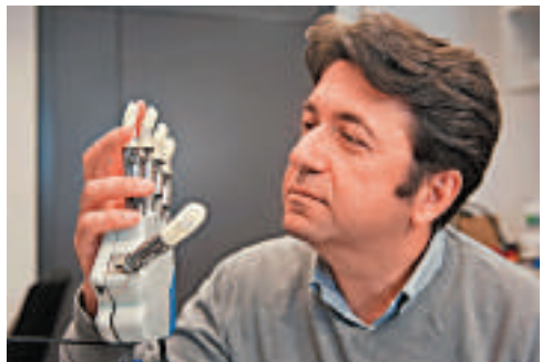
▲ 研究人員手持仿生手