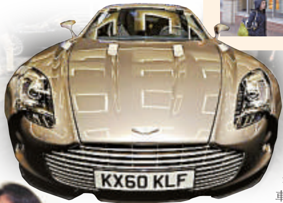
▲ 阿斯頓馬丁將召回17590輛跑車 資料圖片 ◀日本音樂家佐村河內守 美聯社