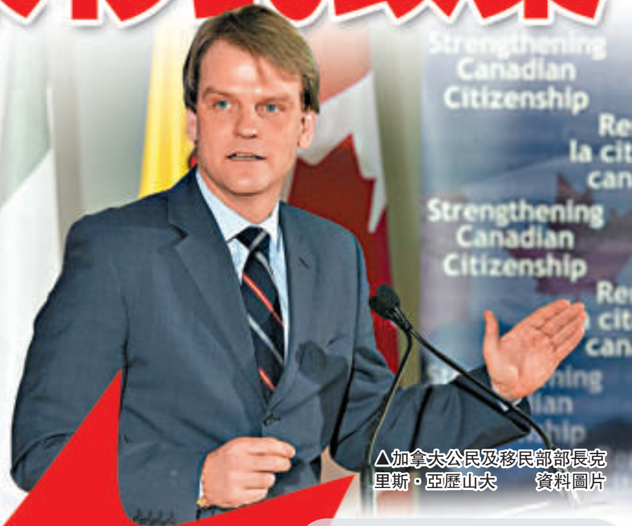
△加拿大公民及移民部部長克里斯·亞歷山大 資料圖片

【本報訊】據英國廣播公司、《多倫多星報》7日消息：加拿大政府6日公布了入籍法修改法案中的一系列改革措施。待走完法律程序，該法案將會成為正式的法律，全面影響移民的生活。有報道指，規定是為針對中國移民而設，而加拿大當局則表示此舉旨在打擊作假。