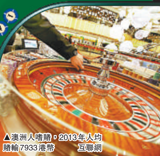
▲澳洲人嗜賭，2013年人均賭輸7933港幣 互聯網

雖然澳洲人的平均賭博損失為全球最高，但美國去年賭博損失總額高達1360億澳幣（約合港幣9334億），居世界之冠。