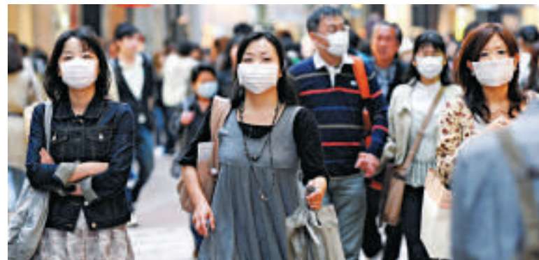
▲近日日本流感盛行，街上行人皆戴起口罩預防

相較之下，很少有內地移民通過北京提出申請。數據顯示，2009-2011年間，只有252個申請案例，香港地區同一時期則有63796例申請。