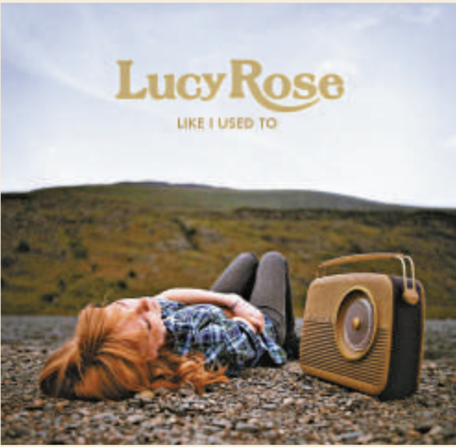
▲Lucy Rose首張專輯《Like I used to》封面

她的嗓音似乎更適合演繹一些溫柔的「吳儂軟語」，但將她的整張專輯聽下來後，你會發現她的音樂風格其實是很多元化的。配器雖然十分精簡，但還是烘托出了她充滿靈性和文采的創作。