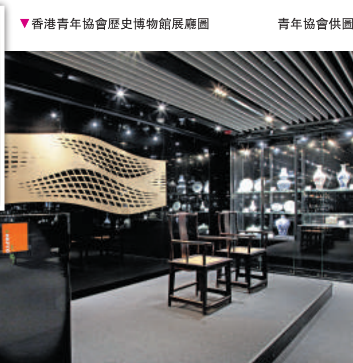
▼香港青年協會歷史博物館展廳圖