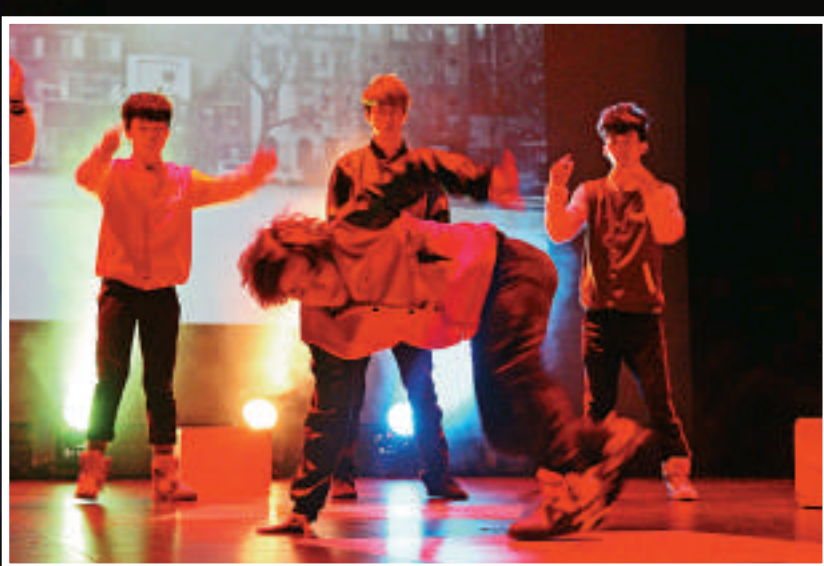
▲演員在台上表演街舞